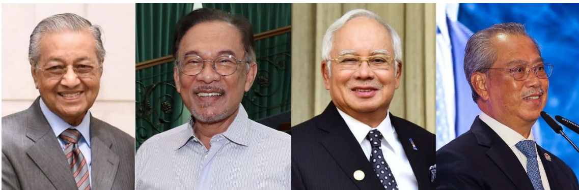
左からマハティール Pejuang 会長、アンワル PKR 総裁、ナジブ元首相、ムヒディン PPBM 総裁。