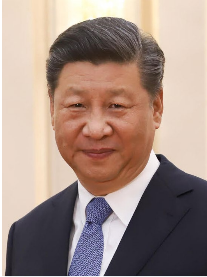
第3期目が确实視されている習近平