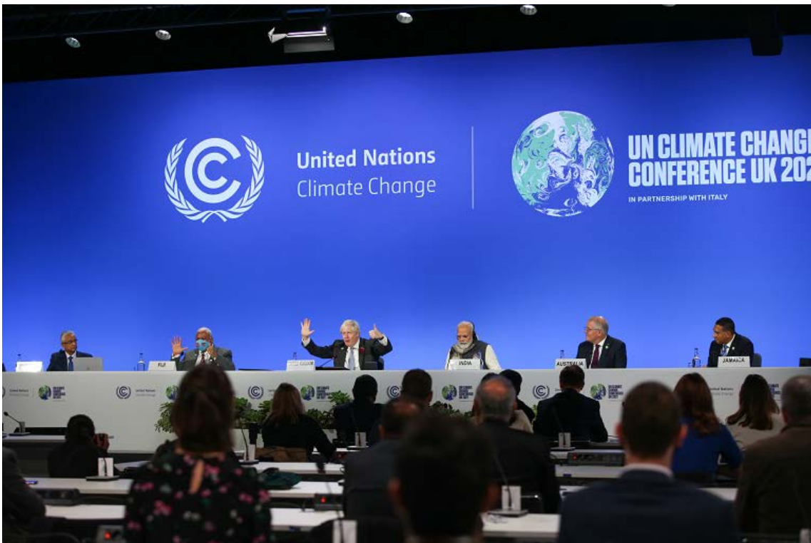
写真2 2021年10月～11月にイギリスのグラスゴーで開かれたCOP26の様子