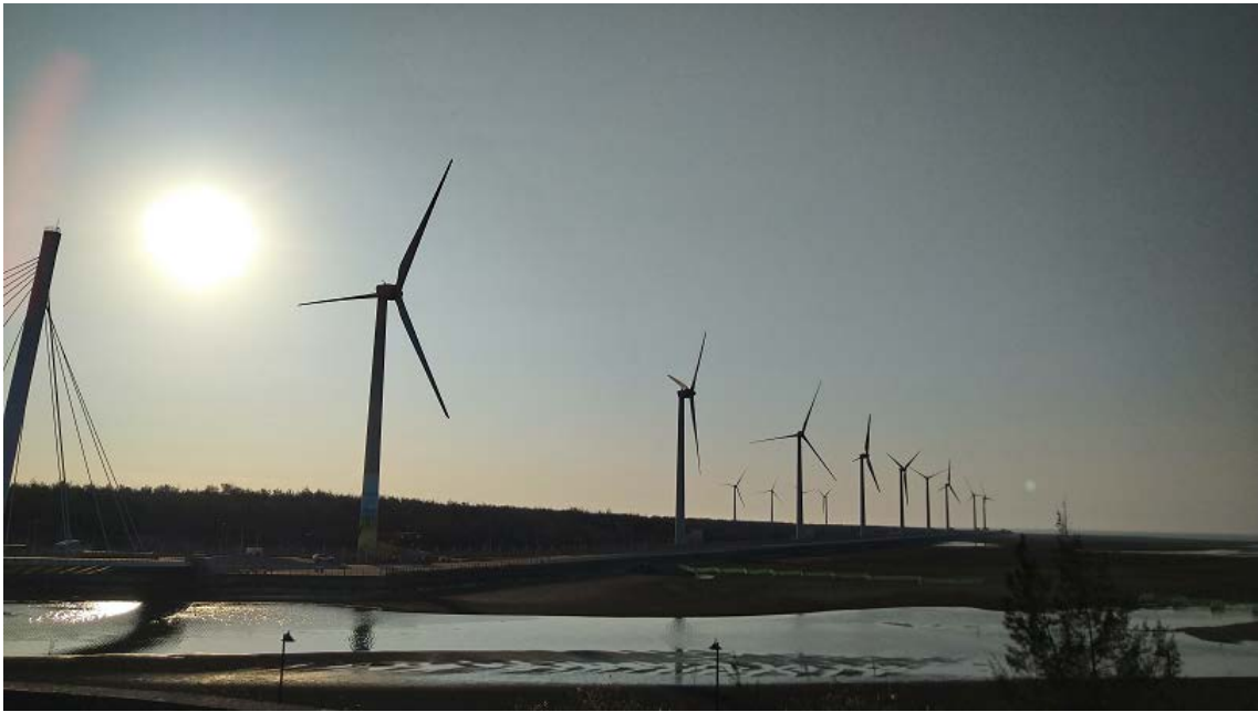
写真1 台湾・台中市海岸沿いに聳え立つ風力発電機。「高美湿地」と呼ばれる環境保護エリアに位置しており、著名な観光地にもなっている。