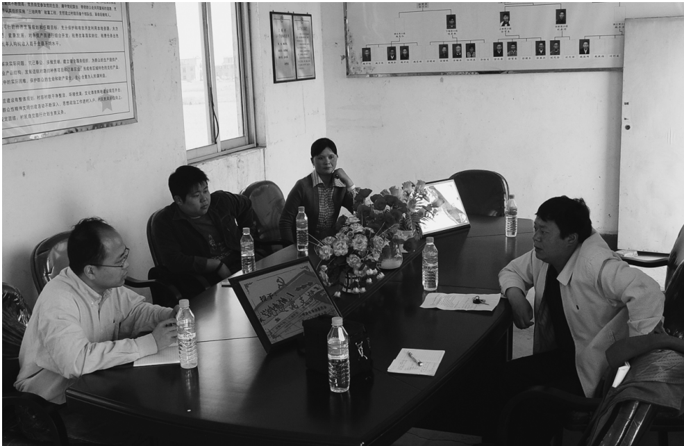
村党支部書記へのインタビュー（江西省，2005年）

般化された結論が血となり肉となるというか、一を聞いて十を知るというようなことが、フィールドワークをしているとできるようになります。