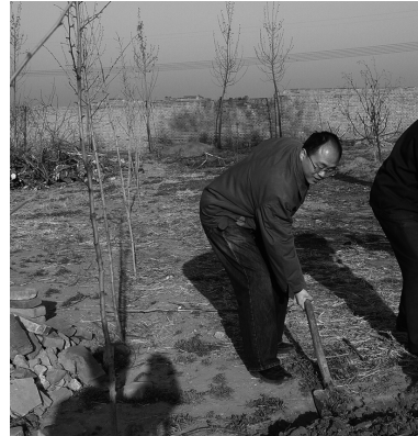
農作業に参加（河北省，2005年）

す。そうしたときに、たとえば中国人の学生がアメリカに出て中国研究をしようとした場合の調査のしやすさ、しにくさということに変化は出てきているのでしょうか。また、彼らが学位を取得して中国に戻ったとき、彼らを取り巻く環境というのはどうなっていると思われますか。