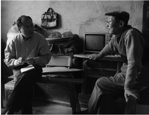
村民へのインタビュー（江西省，2005年）