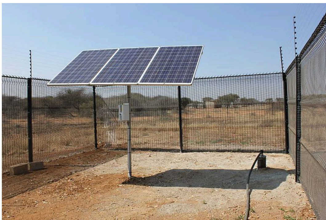
写真 1 ボツワナのモチュディ市で使用される太陽光発電ポンプシステム

例えば、途上国の多くの家庭やレストランでは、今でも薪や炭を使用しています。南部アフリカの内陸に位置するボツワナでは、国際的な支援の下で薪や炭を太陽光発電に替える事業を実施しました（写真 1）。このような取り組みは森林の保護に加え、薪や炭を燃やすときに出る二酸化炭素の排出削減や大気汚染の軽減にもつながります。また、電気が届いていない地域に再生可能エネルギーを普及させる試みもあり、化石燃料による温室効果ガス排出を避けながら、そうした地域で暮らす人々の生活水準を引き上げることができれば、一石二鳥の取り組みになると期待されています。