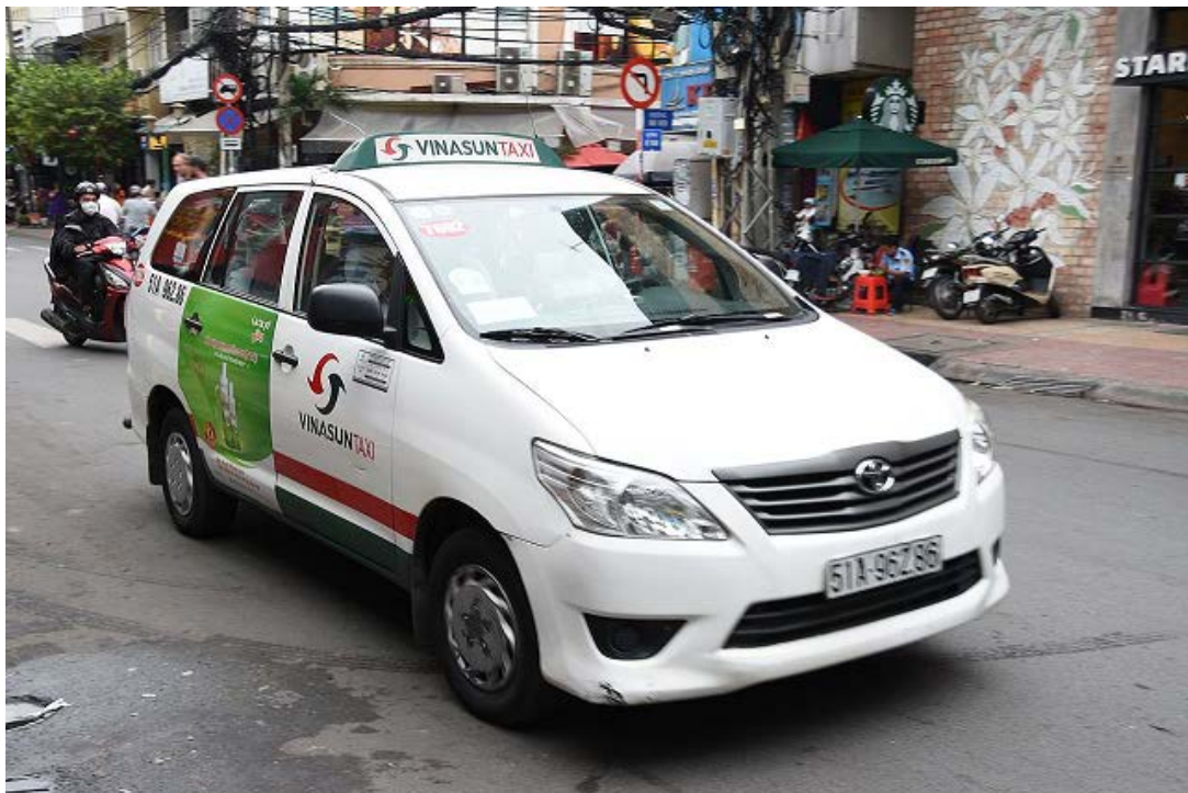
大手タクシー会社ビナサンは 2017 年、グ랩の提訴に踏み切った。

(出所) 交通運輸省決定 24 号 (2016 年 1 月 7 日付) に基づき筆者作成。