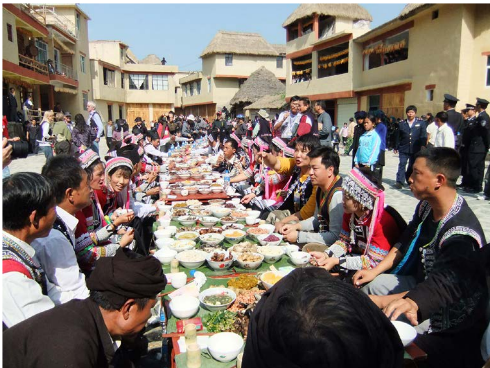
雲南省ハニ族の「長廊宴」。旧正月の宴会も新型コロナウイルス感染拡大の一因と言われる（雲南省紅河イ族ハニ族自治州にて、2010年11月）。