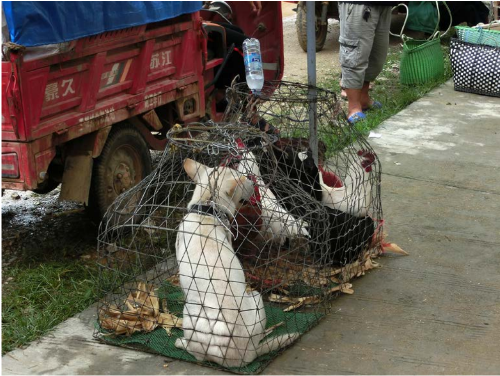
農村の市場で売られる犬とニワトリ（貴州省黔东南ミャオ族トン自治州にて、2018年8月）