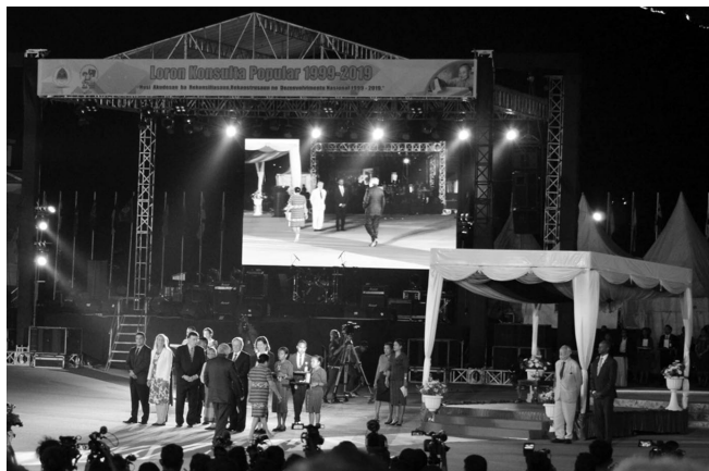
政府主催の住民投票20周年記念式典の様子(2019年8月30日)

ティモール・レステでは、いかに紛争を記録し、記憶していくのかが独立以降の課題である。2005年にはインドネシアによる侵略以降の抵抗運動を記録する抵抗博物館がつくられ、独立から10年を迎えた2012年には大々的な改修工事が行われた。抵抗博物館にはティモール・レステ民族解放軍による抵抗運動や一般住民らによる地下活動などが記録されている。また、1974年から1999年までの人権侵害について調査を行った受容真実和解委員会の事務所は、委員会が任務を終えた2005年以降は人権侵害の歴史を記録する資料館となっている。展示はその後少しずつ充実してきており、2019年には20年前の住民投票前後に各地で起きた虐殺に関する記録、インドネシア支配下で政治犯として投獄された人々の記録などが新たに加わった。紛争や独立闘争の記憶を次世代に伝えていくことは、どの政権にとっても重要な課題である。