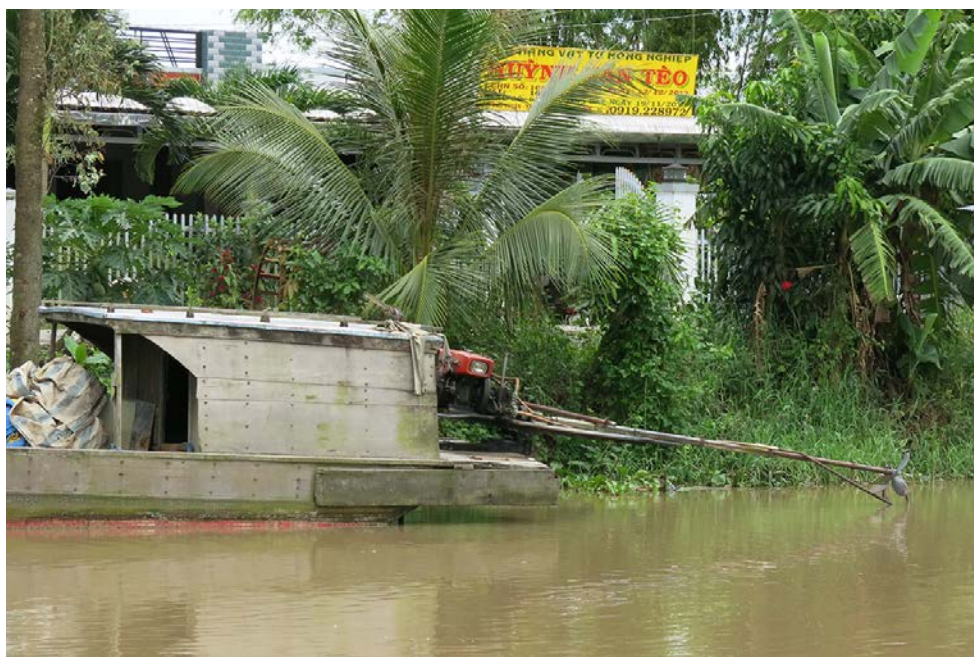
写真4 耕耘機のエンジンは船外機にもなる（アンザン省トアイソン県、2013年10月）