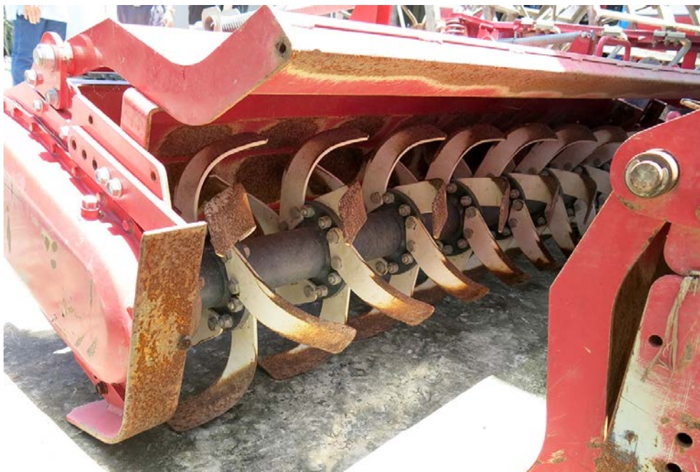
写真1 ロータリーの軸も爪の付け替えがしやすい形状になっている (アンザン省ロンスエン市、2017年8月)