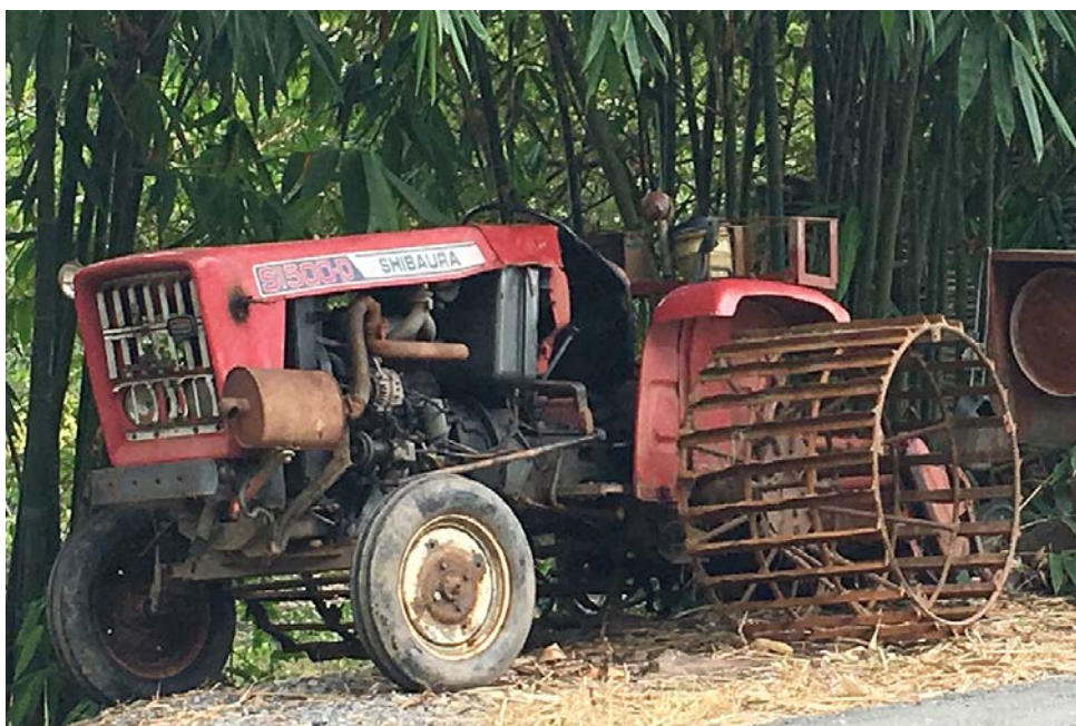
写真2 鉄の車輪を付けたトラクター（ティエンザン省カイバー県、2016年8月）