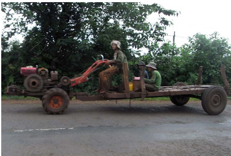
写真3 耕耘機に荷台をつけた運搬車（ザーライ省ブレイク市、2012年9月）