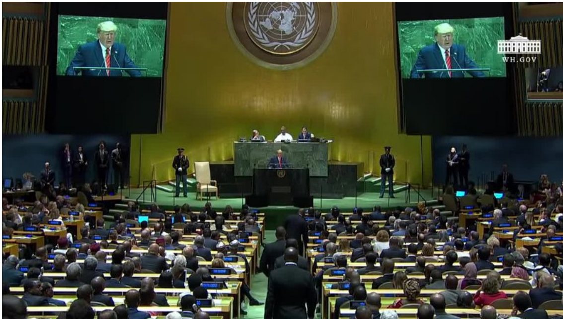
2019 年 9 月 24 日、国連総会で演説するトランプ米大統領。ベネズエラのマドゥーロ大統領を「キューバが送ったボディガードに守られ、自国民から隠れているキューバの傀儡」と非難した。