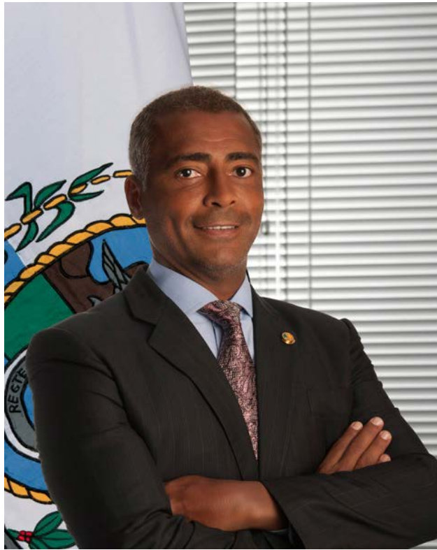
ロマーリオ上院議員（公式プロフィール写真）。(2015 年)