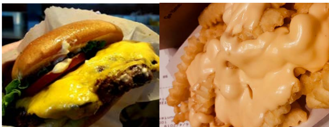
写真1 シェイク・シャックのハンバーガーとチーズフライ