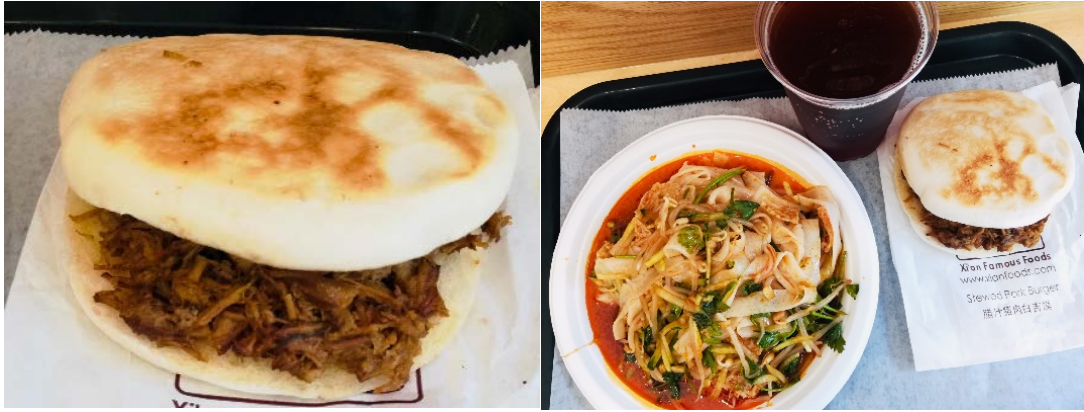
写真2 西安名吃の中国式ハンバーガーと定番のセットメニュー