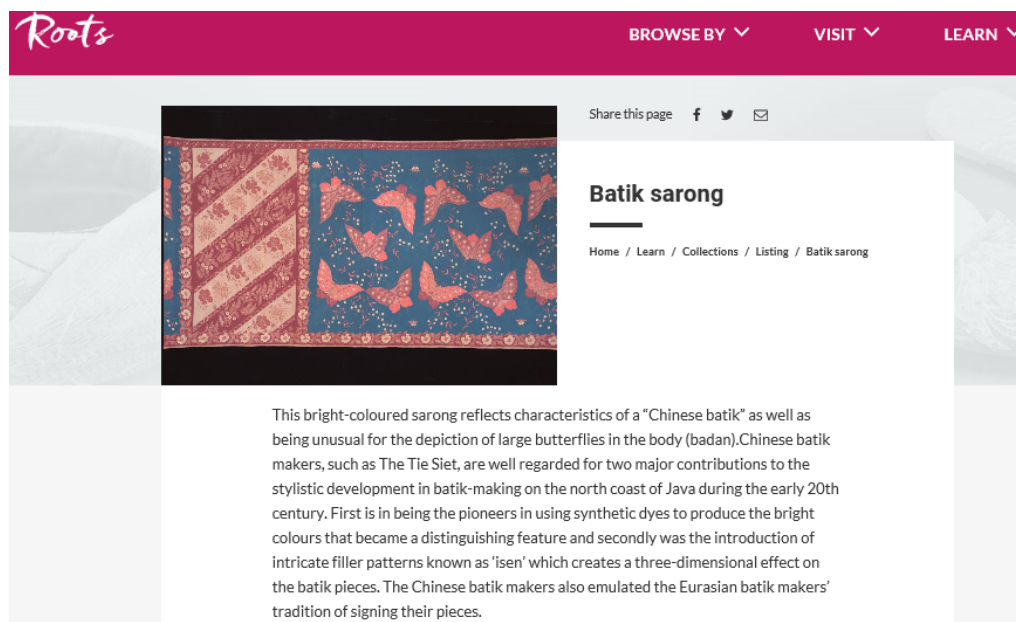
図4 画像とともに作品の詳細情報が確認できる