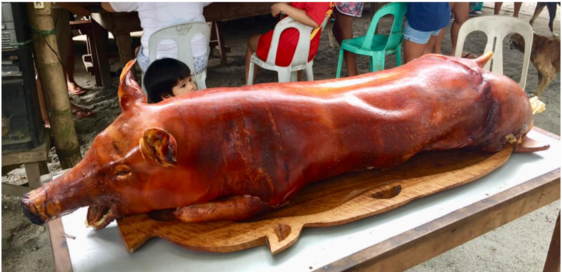
写真4 餡色に焼きあがったレチョン