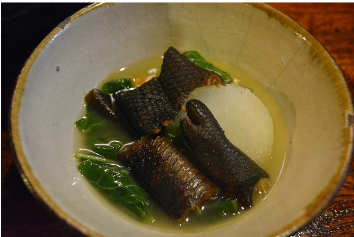
写真2 ウミヘビのスープ