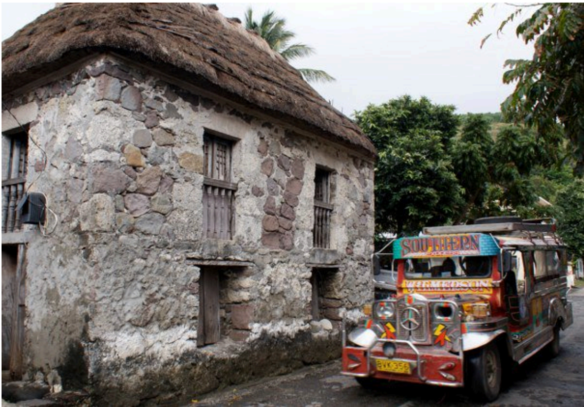
写真1 バタン島のストーンハウス