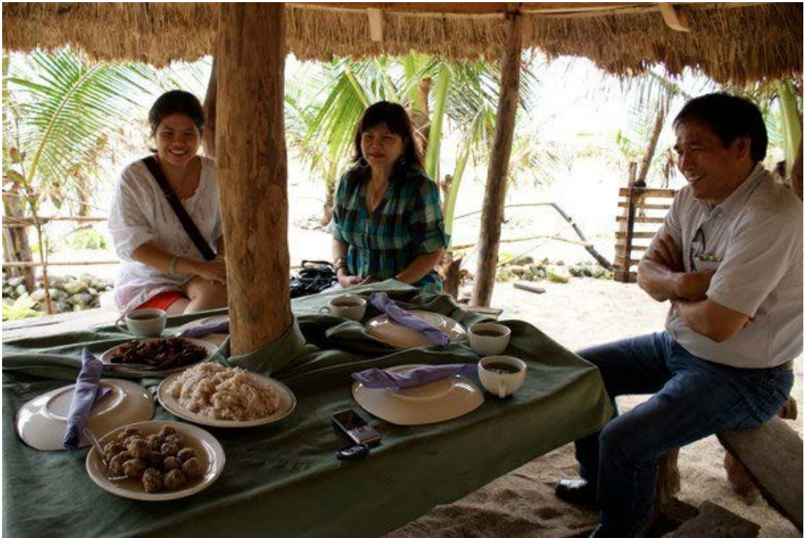
写真3 バタン島の浜辺にて