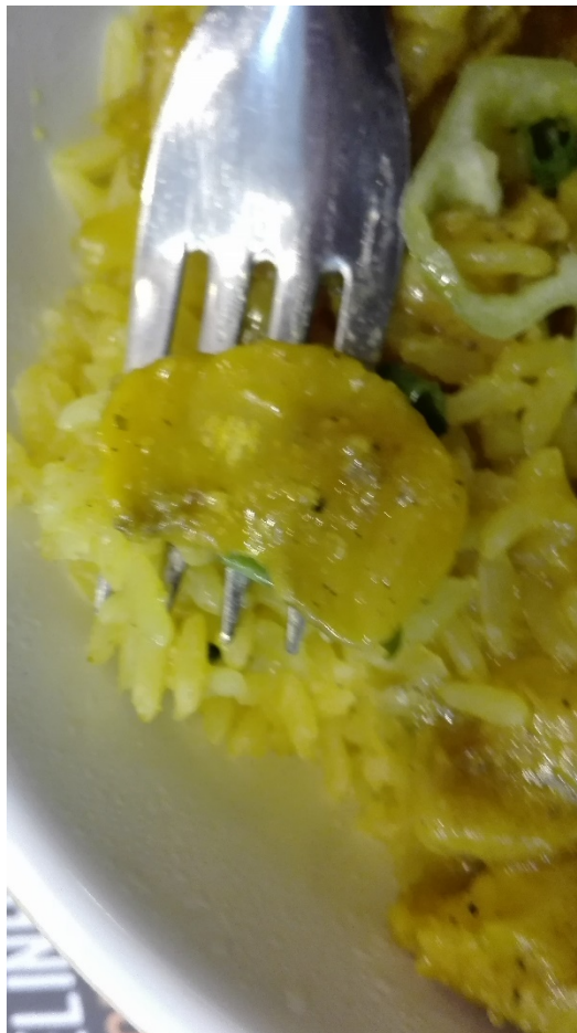
写真2 ガリニャーダ・コン・ペキー（ペキー入りのチキンピラフ・リゾット）に入っているペキーの実のスライス。