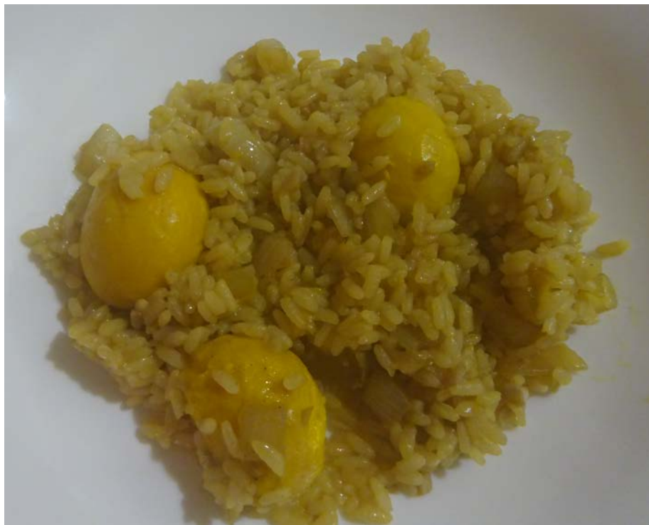
写真3 筆者の調理したアホイス・コン・ペキー。 今回は無事にペキーの実も注意深く食することができた。