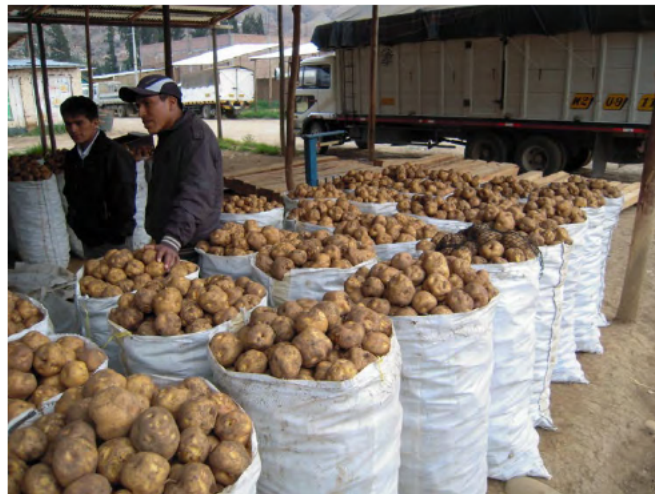
大きさによって分類し（上）、袋に詰めてトラックに詰め込んでリマ市場に出荷する。 ワヌコ市のジャガイモ卸売市場にて。

もう1つは、州の西側の諸郡における自給を中心とした生産である。ここで生産されるのは黄ジャガイモと在来種のジャガイモ（papa nativa）が中心で、余剰を地元の市場や近隣の郡や州の市場に出荷する。化学肥料や農薬を用いず、単収も東南部3郡と比べると低い。産地の高度が高いため、降雨にあわせて植え付ける主な収穫期の生産が中心である。