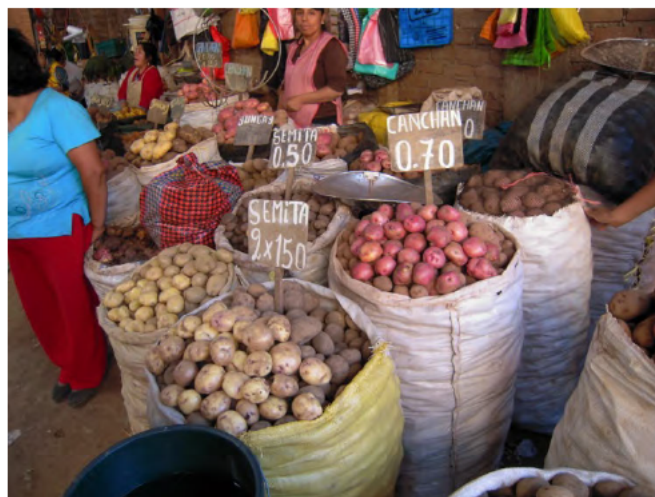
ワヌコ市内の消費者向け市場にて

ペルーでは 1990 年代後半以降、リマを中心にスーパーマーケットや外食チェーンが急速に普及している。このような近代的流通網の発達、農産物の生産者から消費者に至る生産チェーンにどのような影響を与えているのだろうか。筆者はこれに関して、ペルーの伝統的な食料作物であるジャガイモを例として研究を行っている。この研究の調査として 2012 年 6 月 11～15 日に、ペルー中部の山間地域（シエラ）に位置するワヌコ州ワヌコ市で調査を行った。以下にこの調査の成果の一部を紹介する。