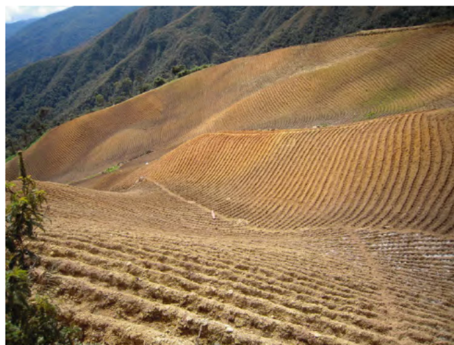
ワヌコ郡ピヤオ地区のジャガイモ畑。 標高 2500～3000 メートルの山頂まで畑が広がっている。