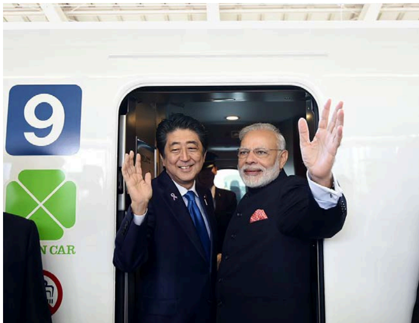
日印首脳会談のために来日した際に、安倍首相とともに新幹線に乗るモーディー首相（2016 年 11 月）

前回総選挙で「モーディー旋風」の影響をあまり受けなかった東部と南部では、地域政党が依然として強い力を持っており、BJP が大幅に議席を伸ばせる可能性はそれほど大きくない。一方、「モーディー旋風」が吹き荒れた中部と西部については、さらに議席を積み増しする余地は限られているうえに、上記の 3 州での州議会選挙の結果が示唆するように、5 年前のようにモーディー人気による強力な追い風が吹いているとは考えられない。さらに、野党間でどの程度まで選挙協力が実現するかによっては、BJP が大幅に議席を減らす事態も十分ありえるのである。