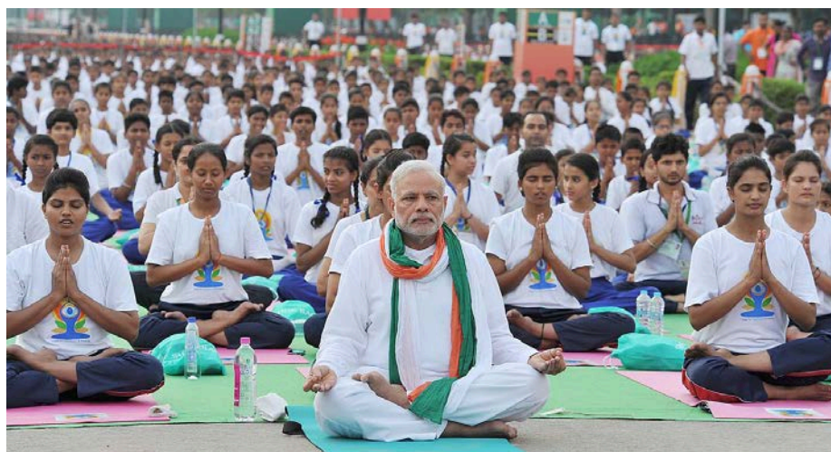
「国際ヨーガの日」のイベントでヨーガを披露するモーディー首相（2015年6月）