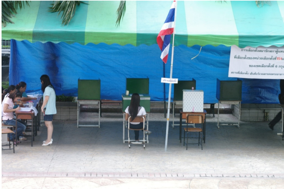
投票所の風景（2011年）

このように議会・選挙制度をめぐる攻防は、司法をも巻き込む形で続いており、選挙後の政権成立過程にも大きな影響を及ぼすと思われる。