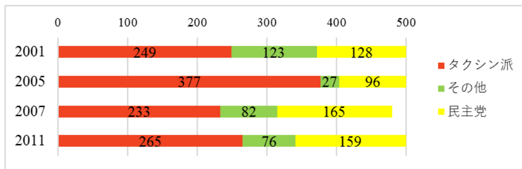
図1 2001年以降の総選挙の結果

タクシン派政党は、2001年以降の総選挙すべてで勝利し、民主的・法的正当性を持っていた(図1)。反タクシン派の一翼を担う民主党は、バンコクやタイ南部で支持を固めるが、巻き返しには成功しなかった。選挙で勝てない民主党、ならびに官僚や軍などの反タクシン派は、選挙自体が不正に行われたと主張し、タクシン派政権による汚職や職権濫用を糾弾することで、その正当性に疑問を呈し、政権退陣へ圧力をかけた。そのために用いられたのが、街頭での大規模な大衆行動や、憲法裁判所への違憲訴訟といった司法手続、そして軍事クーデタといった手段であった。しかしながら、何度倒してもタクシン派は選挙の度に政権に返り咲いてきた。その勢いをいかに抑え込むかが、反タクシン派にとって最大の課題であった。