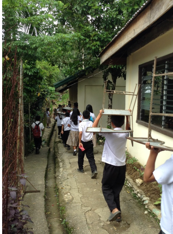
山岳地の高校にて (西ビサヤ地方アンティケ州) 敷地内の急勾配を教室移動するのは一苦勞だ

得られた上記の (a) ~ (c) は、それぞれ 0 から 1 をとる値に基準化される。そして、これらに乗じた HCI もまた 0 から 1 の値をとる。(a) ~ (c) それぞれの個別の定義式と HCI の合成式の詳細については World Bank (2018a: 37-38) を参照されたい。