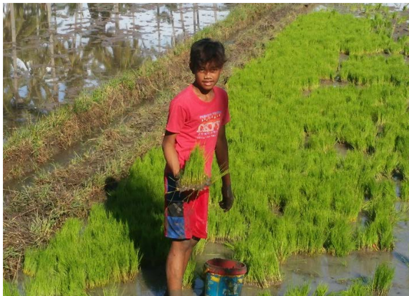
筆者の調査村にて（ミマロバ地方マリンドゥケ州） 高校に行かず日中から農作業をする少年（筆者撮影）

それでは、近年のフィリピンの教育分野への取り組みはどのように評価できるだろうか。フィリピン及びブルネイ・マレーシア・タイを担当する世銀のマラ・ワーリック担当ディレクターは、フィリピンで 2013 年に法的地位を得た「K-12 プログラム」をはじめとした同国の近年の政策内容を評価している。その政策内容とは、(1) 就学前教育の義務化、(2) 後期中等教育の導入（それまで 4 年間だった中等教育を 6 年間に拡充し 2 年制の senior high schools という高校を新規設置）という K-12 プログラムの二大内容と、(3) 基礎教育分野への予算配分の増加、(4) 条件付き現金支給政策（ conditional cash transfer ）の拡充（フィリピンでは Pantawid Pamilyang Pilipino Program 、略して 4Ps と呼ばれている）である。そしてワーリック氏は、今後の同国の人的資本蓄積の効率性を高めていくためには、教育の質・教育効果の改善、そのための学校教員の質の向上（教員養成の改善や教職・教授法開発）が不可欠であるとし、さらに発育不全を減少させる保健政策にも国家が積極的に取り組む必要性を指摘している。