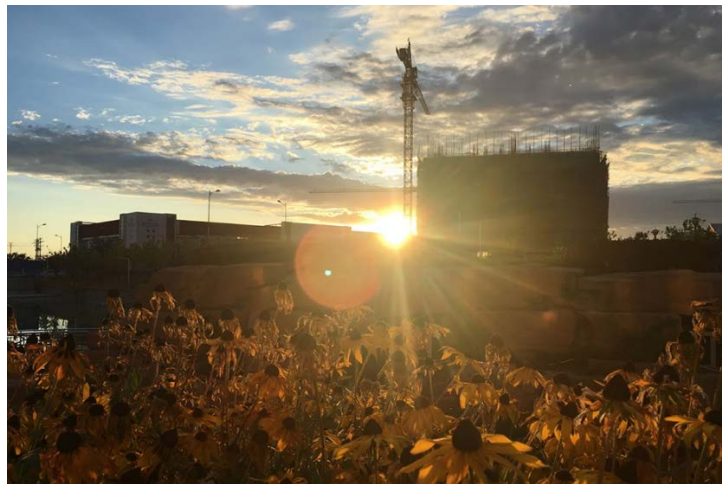
ホルゴス（中国側）

そうした事情から、これまで中国政府はカザフスタンを、その人口、経済規模等の割には、高度に重視してきた面がある。中国の「シャープパワー」の象徴というべき孔子学院は、カザフスタン国内に4カ所設置され、潤沢な資金をもって優秀なカザフスタン国籍の学生を中国に留学生として送り、未来のエリートを養成しているとも言われる。そして中国の進出を歓迎する政府幹部、企業等が、中国のカウンターパートナーとの結びつきを強めていることは、筆者も随所で聞き及んでいる。中国・カザフスタン国境の街ホルゴス（中国側）は、建設ラッシュが進んでいる。そのホルゴスからカザフスタンのアルマトゥまでは中国の援助で高速道路が建設されている 2 。確かに中国の影響力の拡大が現に進行しているようである。