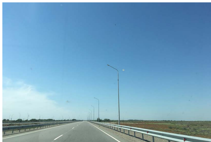
中国の支援で建設されたホルゴスからアルマトゥを結ぶ高速道路