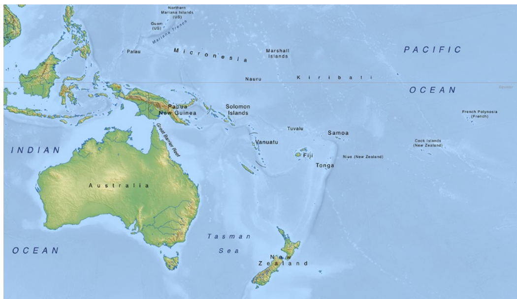
14の島嶼国が太平洋の広大なエリアに点在（By Miller, MAPSWIRE ）。

中国のプレゼンスと影響力は、オセアニアに位置する太平洋島嶼諸国でも確実に増大している。オセアニア地域での中国の影響力の拡大に関する最近の分析では、中国の対オセアニア各国への経済援助の拡大を議論の出発点にするものが多い。それは、中国と当該地域との関係が中国・太平洋島嶼国経済開発協力フォーラム（China-Pacific Island Countries Economic Development and Cooperation Forum）を通じて急速に強化されてきたことに起因する。同フォーラムは、中国と太平洋島嶼諸国間の貿易や投資、観光などを促進することを目的としており、第1回は2006年4月にフィジーの首都であるスバで開催された。第1回フォーラムには、中国から温家宝首相が出席し、太平洋島嶼諸国に対し、3年間で3億円の融資や2,000人の政府職員・技術者への訓練プログラムの実施などが表明された 1 。第2回フォーラムは2013年11月に広州で開催され、汪洋副首相が出席した。第2回フォーラムでは、インフラ開発などのために10億USドルの融資の追加などが表明された 2 。