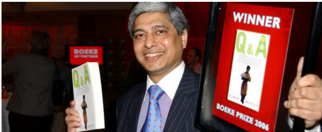
『ぼくと1ルピーの神様』（原題：Q&A）を手にポーズをとるヴィカース・スワループ。

ちなみに、著者のヴィカース・スワループの本業は作家ではなく外交官であり、数 ヶ国での勤務の後、在大阪インド総領事、外務省報道官を経て、2017年からは大使と してカナダに赴任している。デビュー作の『ぼくと1ルピーの神様』（子安亜弥訳、 RH ブックス・プラス、2009年）は、小説それ自身としてよりも、大ヒット映画『ス ラムドッグ$ミリオネア』の原作としてむしろよく知られているといっただろう （ただし、映画には原作の小説とは異なる点がある）。