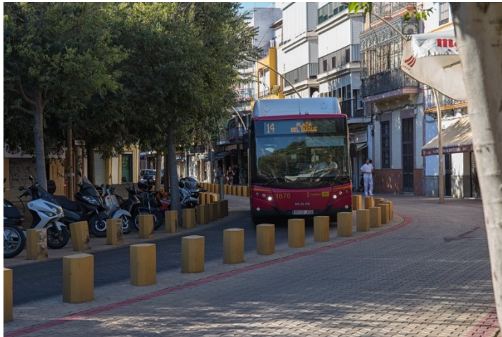
旧市街部（アラメダデヘルクレス広場内）を走る市内バス