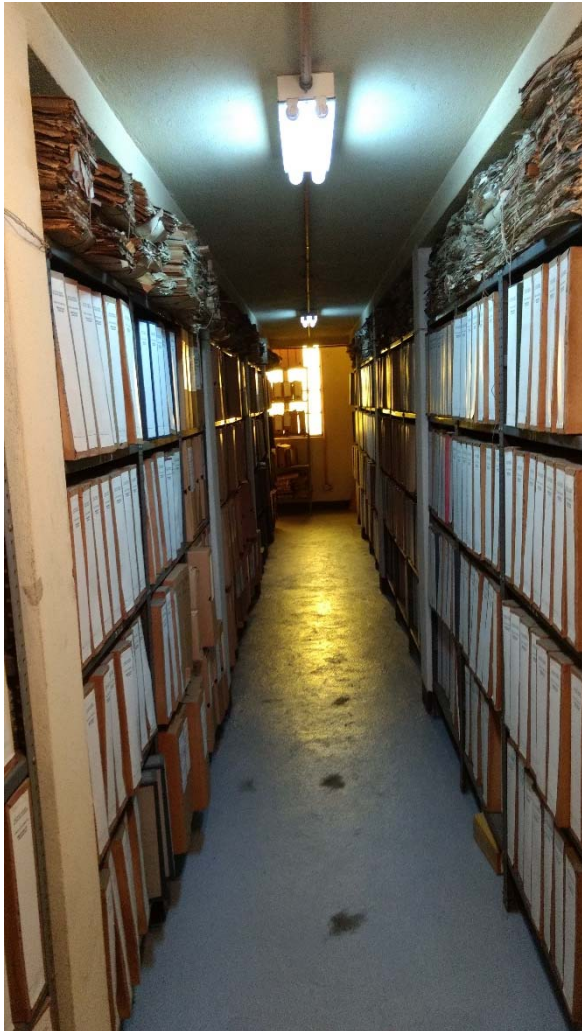
写真 2 グアテマラの中央アメリカ総合文書館の収蔵庫。窓に紫外線を遮断する加工がなされているため、黄色味がかかった光が差し込んでいる。

あらゆる国家行政の中で、公文書管理行政のプライオリティは極めて低いようで、人手不足も保存スペースの問題も、財政面の事情で改善ができないようであった。その中でも、収蔵庫の窓に紫外線を遮断する加工を施したり【写真 2】、各所に除湿器を設置したり、文書と文書の間に脱酸紙を挟んだりなど、保存に関してきめ細かな対応を施していた。もし先述の諸問題を解決し、中央アメリカ総合文書館に公文書が移管されるようになったとしたら、一定の質を担保した保存がなされることが期待される。