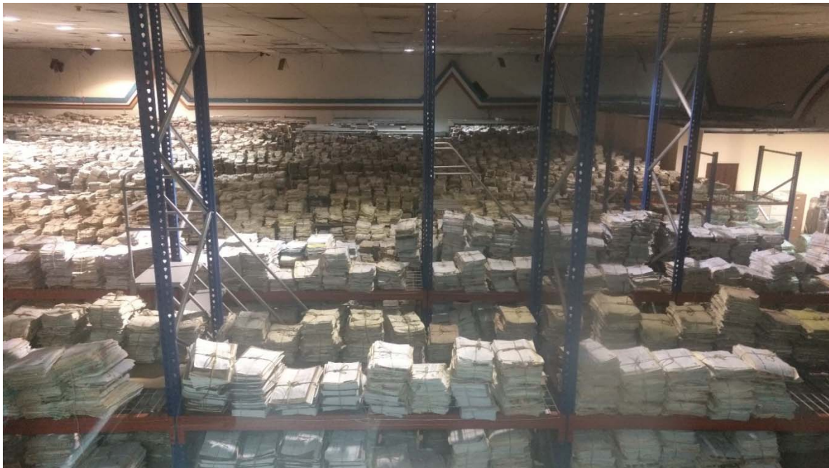
写真3 パナマの司法文書館（首都の施設）の様子。高さ2～3mに積まれた文書の山が広がっている。