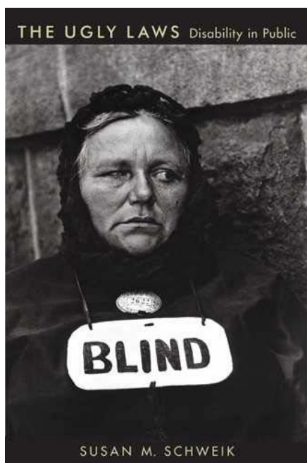
スーザン・シュヴェイク著『醜陋法』表紙

カリフォルニアは上記の「醜陋法」でもアメリカの先進地域であったが、アメリカ優生学の研究でも実は先進地域であった。優生学とは、ナチスが行ったドイツ民族の優越性信奉とそれと轍を等しくしたユダヤ人ホロコーストが有名であるが、人には優秀で残すべき遺伝子と劣悪で絶つべき遺