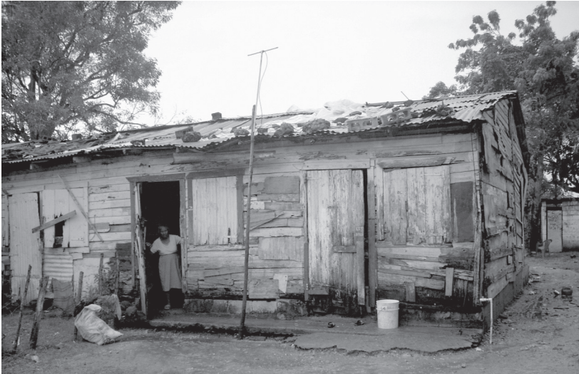
ドミニカ共和国サンペドロ・デ・マコリス郊外の、ハイチ移民の住居（2016年12月）。