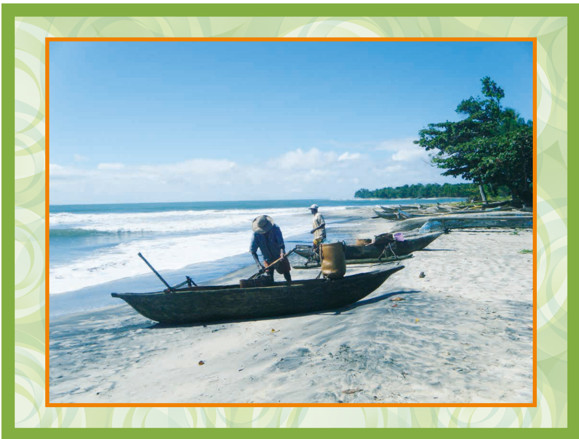
マダガスカル東部の漁師