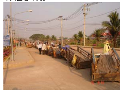
(写真③) 早朝、カラの荷車を曳きタイ側に入るカンボジア人が長蛇の列を作っていた。

また、アランヤプラテートからカンボジア内陸方面に十数km入ったところには、カンボジアが広大な工業団地を建設する予定である。昨年末には、その建設現場も視察をした。繊維産業やバイク製造などを中心に輸出企業を150社ほど誘致する予定とのことであり、実現すればカンボジアに大きな経済効果をもたらすであろう。また、同工業団地の最北端においてタイとの国境ゲートを設置するため、稼動し始めれば両国間のアクセスは格段に向上する。現在のアランヤプラテートは非常にゆっくりと時間が流れる町であるが、国境経済圏構想を掲げるタイのビジネス拠点として非常に重要な位置付けにある町であろう。数年後、当地はどのように変貌しているのか興味深いものである。