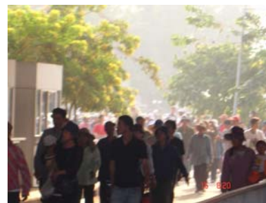
(写真②) カンボジア側に延々と続くタイ入国者の列。

昨年末には、カンボジア側も何箇所か視察をした。アランヤプラテートの反対側ポイペットを訪問した際には、1)カンボジアからタイへは、道路建築などで使用する砂をかなり輸出していること、2)ポイペットからは1日約3,000人のカンボジア人が日帰りでタイに出稼ぎや買い付けに出かけていること、などをヒアリングした。今回、早朝及び夕刻のラッシュ時を視察してみたが、荷車に砂の入った袋を乗せタイに持ち込む人を数多く見かけた(写真①)。しかし、しばらくゲート付近を観察していると、両国を往来するカンボジア人は少なく見ても万に近い数千人はいるのではないだろうか。延々と列が連なっていた(写真②、③)。