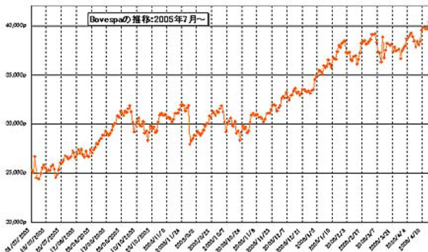
グラフ 2 サンパウロ株式市場 (Bovespa 指数) の推移：2005 年 7 月～

株式市場： 今月のサンパウロ株式市場 Bovespa 指数は、特に月の半ば以降、好調な取引となった。この要因としては、Selic 金利の更なる引き下げ、石油の自給率達成など、ブラジル経済の先行きに対する楽観的な見方が強まったことが挙げられる。そして、26 日には初めて 4 万ポイントを突破する 40,401 ポイントの史上最高値を記録し、そのままのレベルで今月の取引を終えた (グラフ 2)。