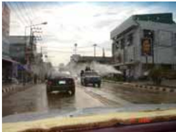
ウボンラーチャターニーにて

たり、拳句には放水車まで用意する始末。ドラム缶に目いっぱい水を入れた水をかけられると、暑いタイでもさすがに震えます。お祭り気分が高揚し、飲酒運転や無謀な運転も横行します。今年死者 476 名、負傷者 5,985 名だそうです。 了