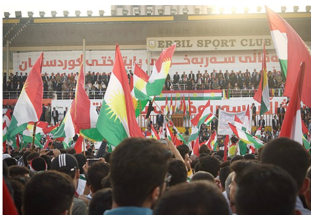
マスード・バルザーニ大統領の演説を聴く支持者

9 月 25 日に実施された北イラクでの住民投票、およびその結果を最も重く受け止めたのはイラク中央政府、トルコ、イランであった。イラクは当然のことながら、隣接するトルコとイランにも、本特集の最初にみたように多くのクルド人が住んでいる。現在のトルコでは、クルド人はトルコ人と共生している。しかし、クルド人とトルコ人が歴史的に対立してきたのも事実である。