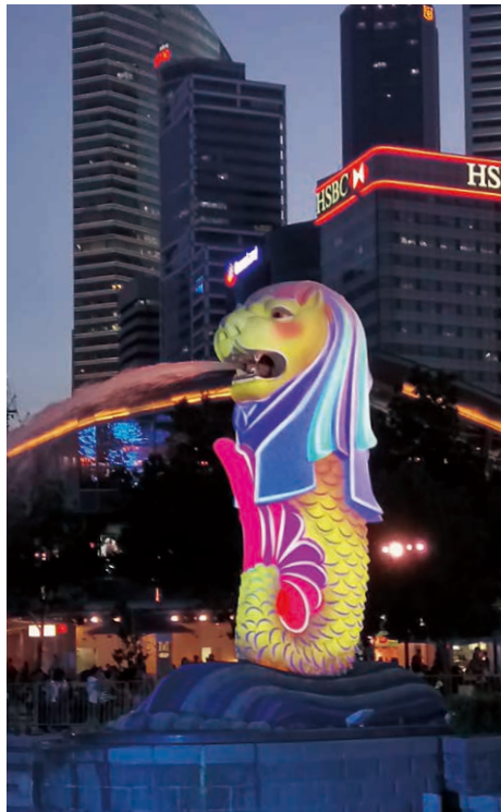
カラフルなマーライオン

南向き（反時計回り）に湾を回ろう。シンガポールの中でも指折りの高級ホテル、フラートン・ベイ・ホテルを通過し湾の南側に着くと、シンガポール最大の金融街が広がっている。地上60階程度の高層ビルがまさに乱立している。この南側では主に、会社帰りの女性達を中心に、エアロビクス、ヨガなどが行われている。エアロビクスの先生がだいたいおネエ系なのが気になるが、皆思い思いにストレス解消を行っている