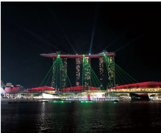
対岸から見たSPECTRA時のマリーナ・ベイ・サンズ

資源がほとんどないシンガポールにおいて、観光に重点を置いた都市開発を進めていた国の政策は大成功し、マリーナ湾には1年を通して多くの観光客が押し寄せている。年末・年始のカウントダウンや、8月9日の建国記念日などには、大規模な花火も打ち上げら