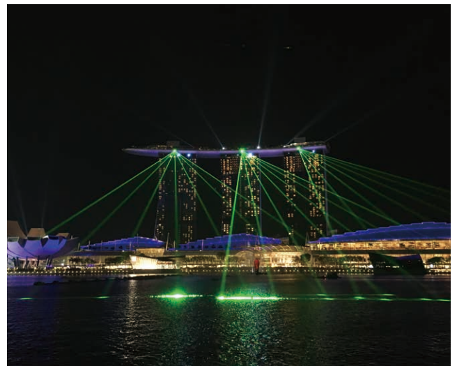
同じくマリーナ・ベイ・サンズ