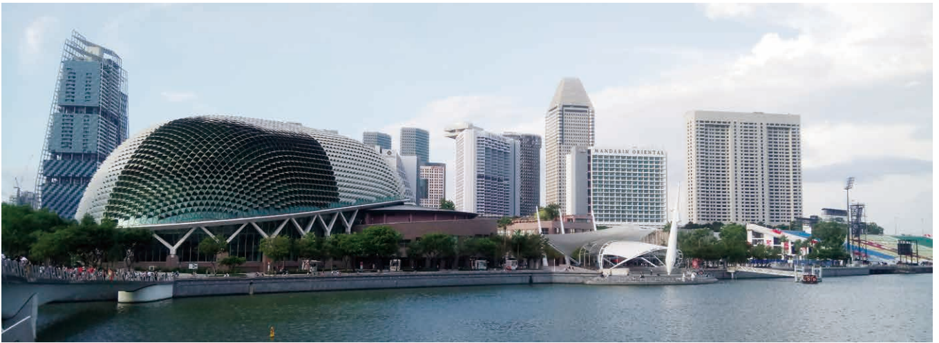
ドリアン型の複合施設