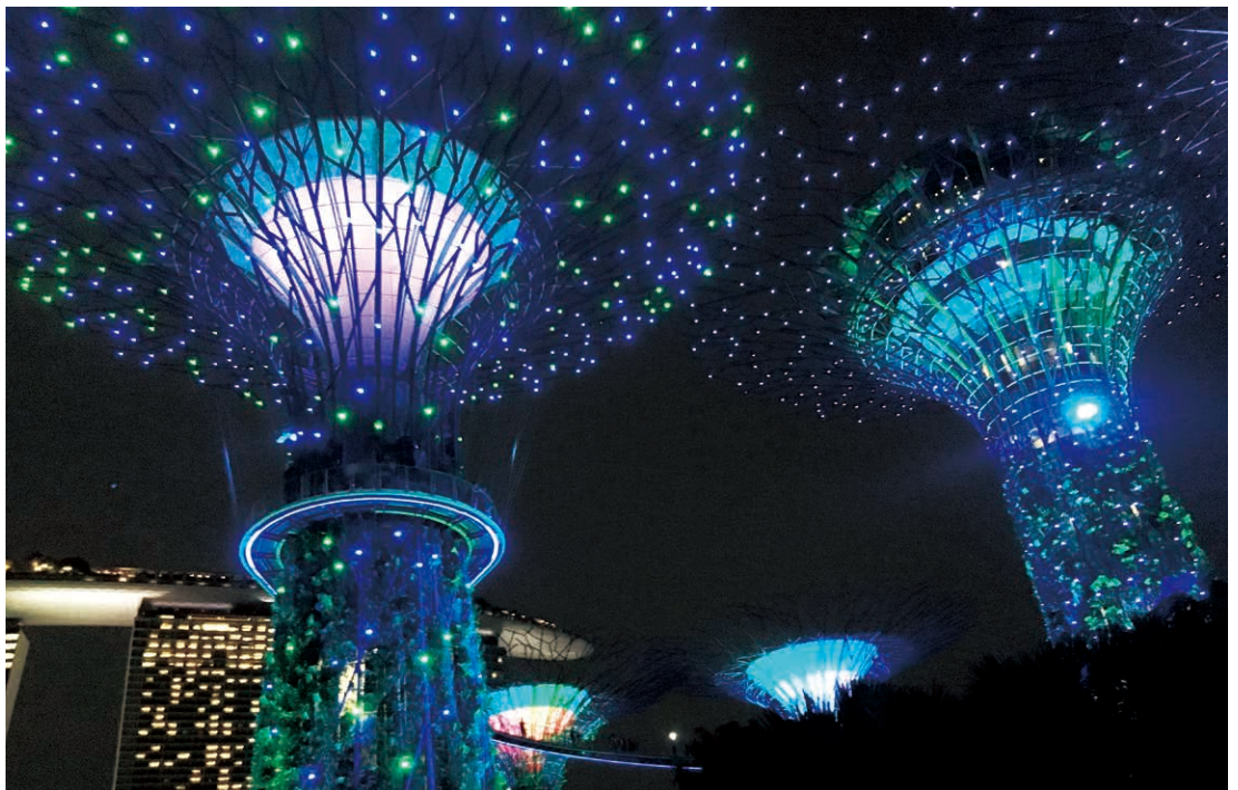
ガーデンズ・バイ・ザ・ベイに おけるガーデンラプソディ

れる。またマリーナ・ベイ・サンズのさらに東側には、 ガーデンズ・バイ・ザ・ベイという植物園があり、こ ちらでも毎晩、音楽に合わせて植物がライトアップさ れる、ガーデンラプソディというショーが行われてい る。このエリアに はまだ空き地と なっているところ もあり、これから 大規模な開発がさ れていく予定だそ うだ。これからも ますます進化する マリーナ湾から目 が離せない。