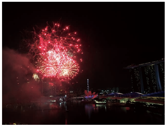
年末・年始のカウントダウン花火大会

れる。またマリーナ・ベイ・サンズのさらに東側には、 ガーデンズ・バイ・ザ・ベイという植物園があり、こ ちらでも毎晩、音楽に合わせて植物がライトアップさ れる、ガーデンラプソディというショーが行われてい る。このエリアに はまだ空き地と なっているところ もあり、これから 大規模な開発がさ れていく予定だそ うだ。これからも ますます進化する マリーナ湾から目 が離せない。