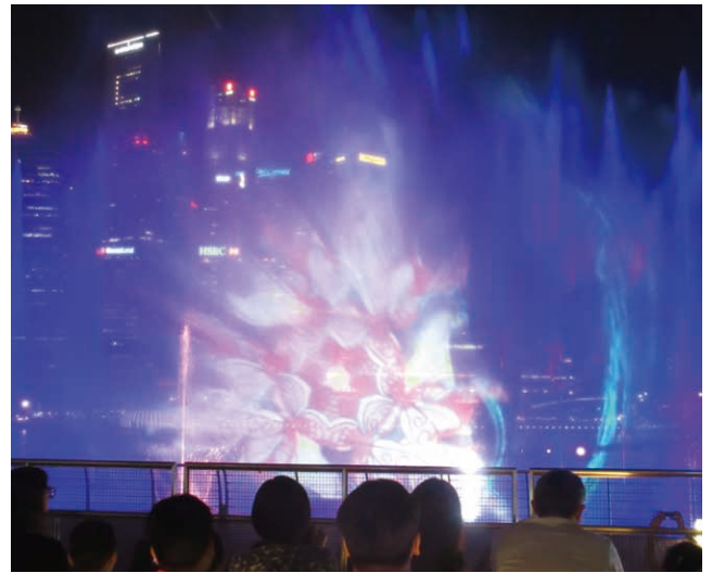
水のスクリーンに映し出される万華鏡

最後は湾の北側である。ここには地元で「ドリアン」という愛称で呼ばれている、「エスプラネード・シアターズ・オン・ザ・ベイ」という複合施設がある。コ