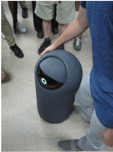
写真 16 NXROBO