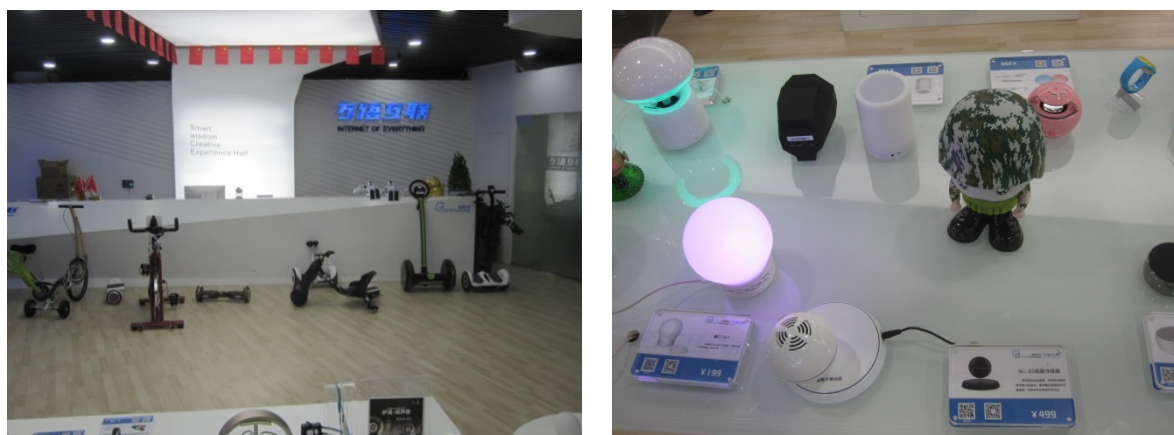
写真 7 舊図科技