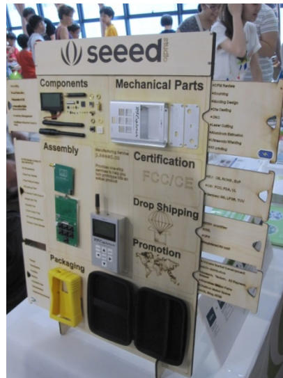
写真 17 メイカー・フェア・シンガポール 2016 に出展する Seede

(注) 同フェアは 2016 年 6 月 25 日・26 日の期間、シンガポール工科デザイン大学 (SUTD) で開催。