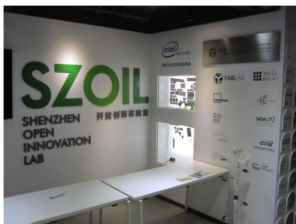
写真 8 SZOIL と SegMaker

Design Strategy Limited) を始めとした多くのデザイン企業が入居している。最後に、SegMaker は、深圳市所管の国有企業である深圳市賽格集団（Shenzhen Electronics Group）によって設立されたオフィス・スペースだ（写真 8 右）。開設にあたっては、DMM.com の DMM.make AKIBA（東京都）も参考にしたようだ（写真 9）。SegMaker は政府系の施設のため、政府からの資金が得やすいというメリットが入居チームにあることを強調していた。2016 年 4 月時点の入居企業は、ロボット作成プラットフォーム企業を含めた 6 社で空きスペースも目立っていたが、同年 10 月時点では 30 社に増えていた。今回訪問したフロアは大部屋だったが、成長したチームのための個室も別フロアに用意されているようだ。また、賽格集団は 2015 年 11 月から製品の展示場も運営しており、起業家や消費者の交流を促進しようとしている（写真 10）。