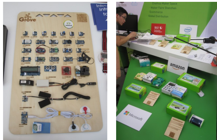
写真 4 Seed のキット

幅広い事業のなかで、収益の柱となっているのは製品開発のためのキットの販売だ。キットには、タッチセンサーなどの各種機能が搭載されたモジュールの Grove システム（写真 4 左）や、ウェアラブル・デバイスを作製するための Xadow システムといったオープンソース・ハードウェアがある。製造受託同様、キットも海外からの注文が多い。なお、Seed は今後、IoT をキーワードにした産業界向けの事業と、子どもがモノづくりを体験することができる教育用キットの販売の二方面から、さらなる成長を目指したいとのことであった。アマゾンの AWS など、大手の製品・サービスを活用したシステムを開発するためのキットもすでに販売している（写真 4 右）。