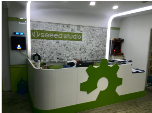
写真 1 Seed の本社と創業者

増加傾向にあるが、今のところ、約 90%が海外からのものだ。Seed は世界中の起業家にとって有名な存在となっている。