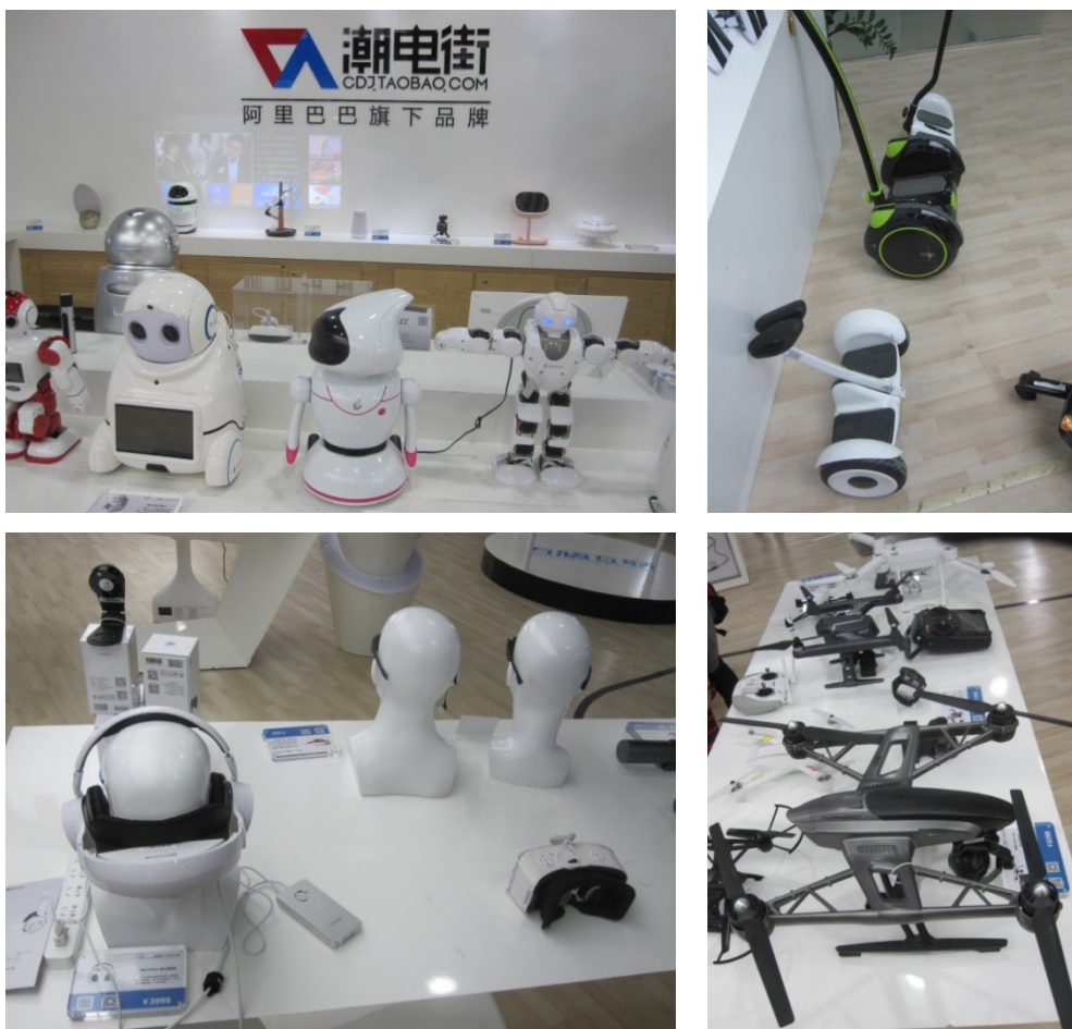
写真 18 製品カテゴリー内の激しい競争