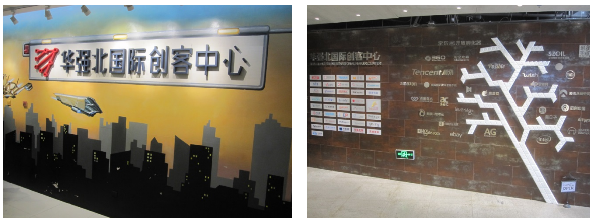
写真 6 華強北国際創客中心