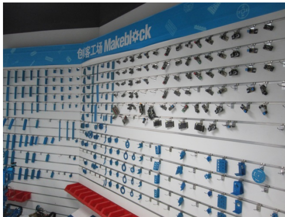
写真 13 Makeblock

成功)や、ドローンを組み立てることのできる Airblock (Kickstarter 出品中)があり、ラインナップを拡充させている。事業が急拡大してきた一方で、Makeblock に似たシステムを販売する企業も増えている(写真 14 上の左以外)。従業員によれば、Makeblock の優位性はプログラミング・システムやコミュニティなどさまざまなファクターから成り立っているため、完全な模倣は難しいはずとのことであった。模倣の被害を減らすためには、知的財産権を守るだけでなく、簡単に模倣できないよう、事業をさまざまなファクターから構成することも必要ようだ。海外市場ではブランド力のある Makeblock だが、価格が高いこともあって、国内市場では安価な製品が出回る可能性も高い。今後どのように国内外で事業を拡大していくことができるのか興味深い。