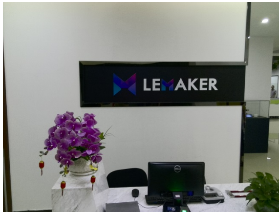
写真 15 LeMaker