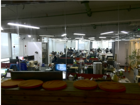
写真 5 HAX