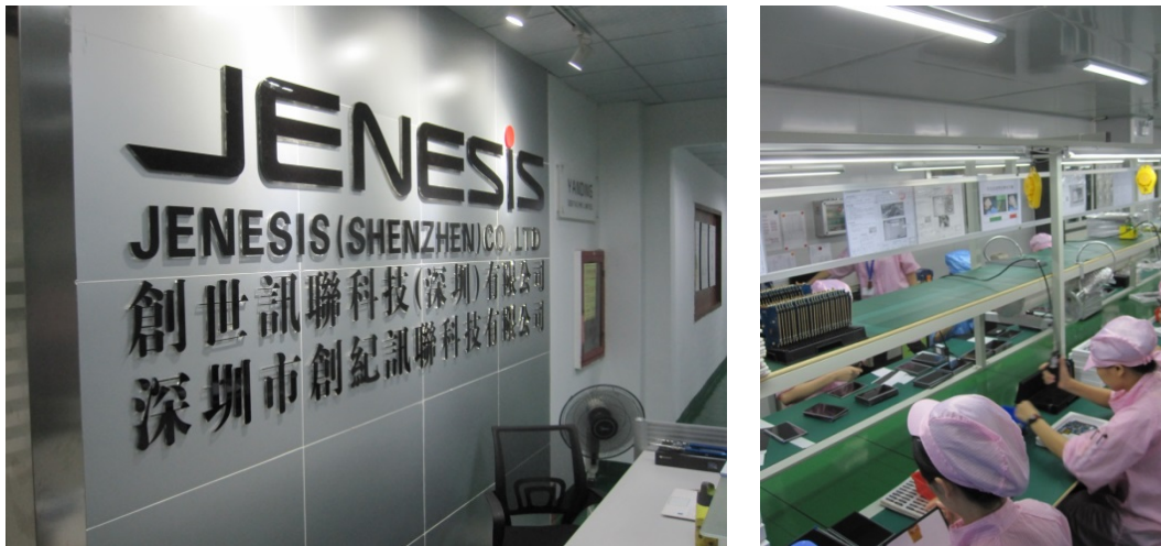
写真 12 Jenesis