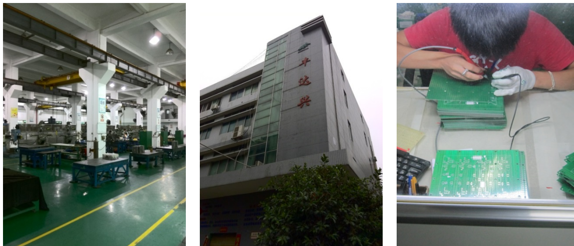
写真 11 製造企業

を技術開発にあててるのが最適なのかは別途検討する必要があるが、人件費が高騰するなか深圳市内で操業を続けていくためには、品質の向上が不可欠のようだ。