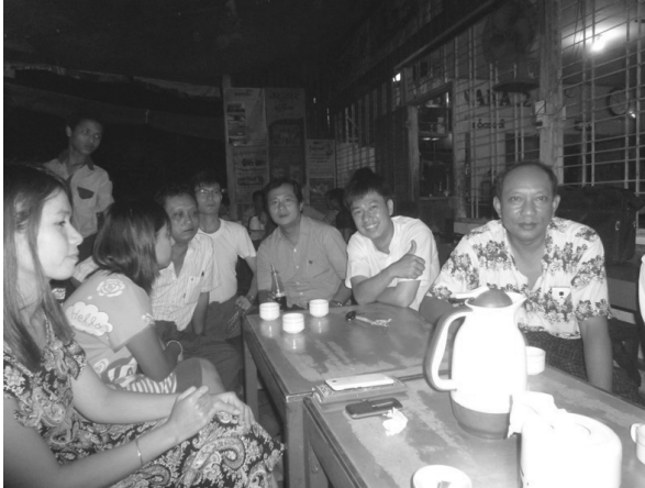
写真2-B 選挙前夜、喫茶店で支援者と談笑する NLD 候補

NLD の新人候補者は右からふたりめ。ヤンゴンで医科大学を卒業した医者であるが、現在は地元でビジネスをしている。選挙前日のこの日は選挙活動が禁じられていたが、夜に支援者と喫茶店で談笑していた。(筆者撮影、2015年11月7日)。