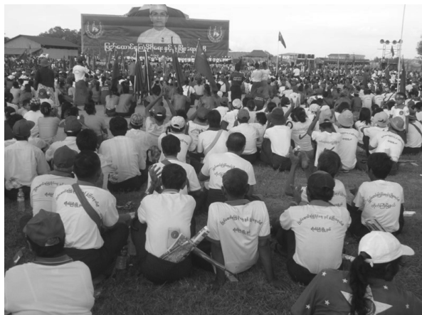
写真2-A ヤンゴン郊外で開催された USDP の集会

USDP の党のカラーは緑色である。集会参加者の多くは USDP から支給された緑色の服を着ている。広場の中央にはテインセイン大統領 (USDP 党首) の写真が立てられている。(筆者撮影, 2015年11月6日)