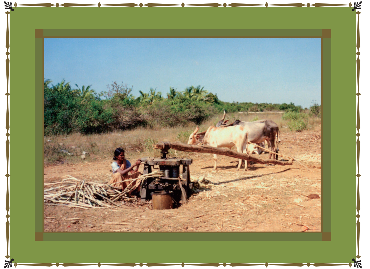
「サトウキビの圧搾」1991年 アーンドラ・プラデーシュの村にて