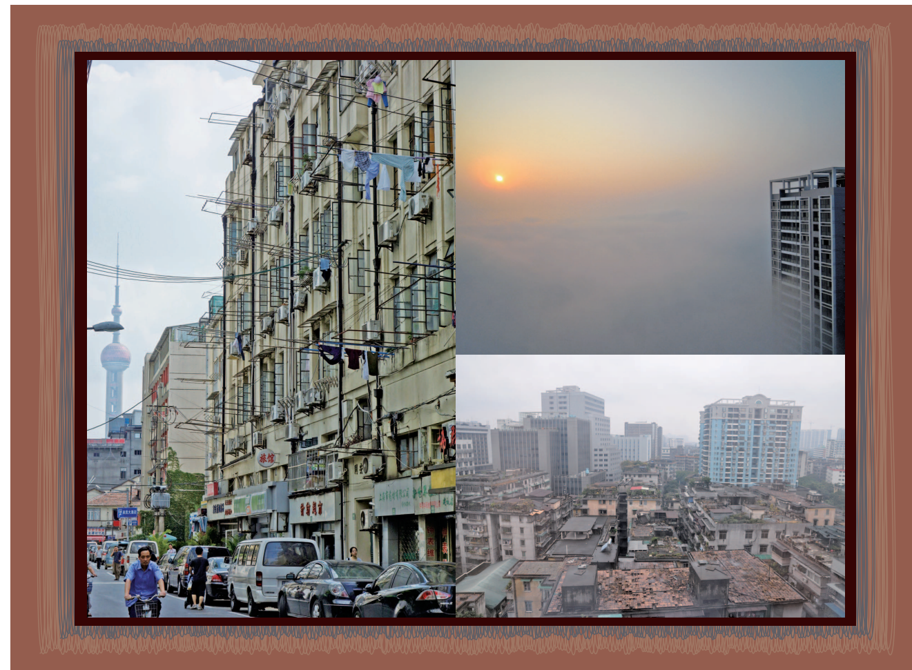
右上：朝のスモッグ（2010年12月、南寧市） 右下：広州市越秀区の一角（2010年1月） 左：上海市黄浦区の一角（2013年9月）