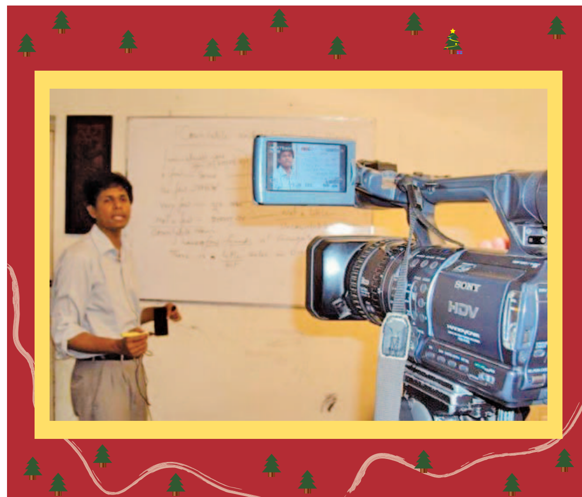
DVDへの講義の収録風景