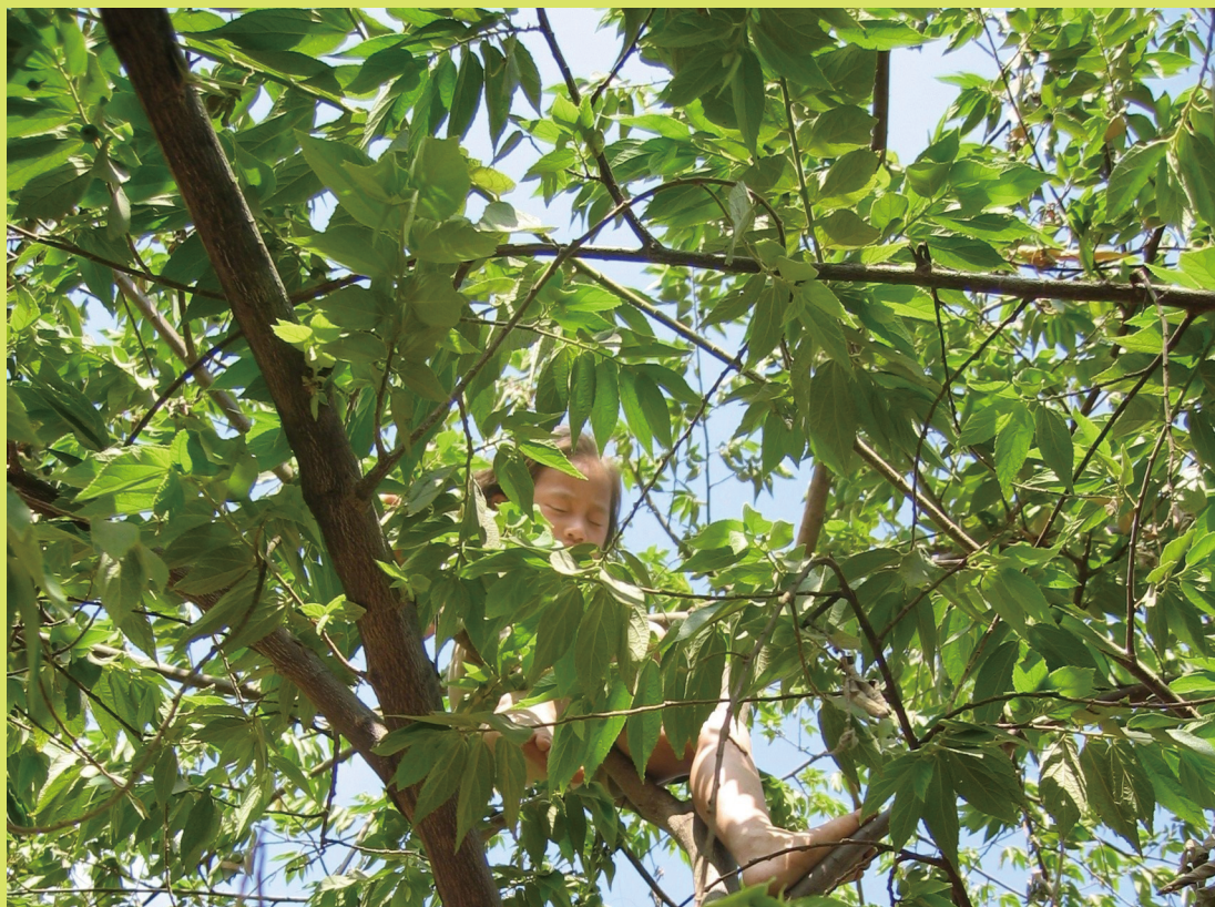
モン族の少女(ラオス・ビエンチャン)