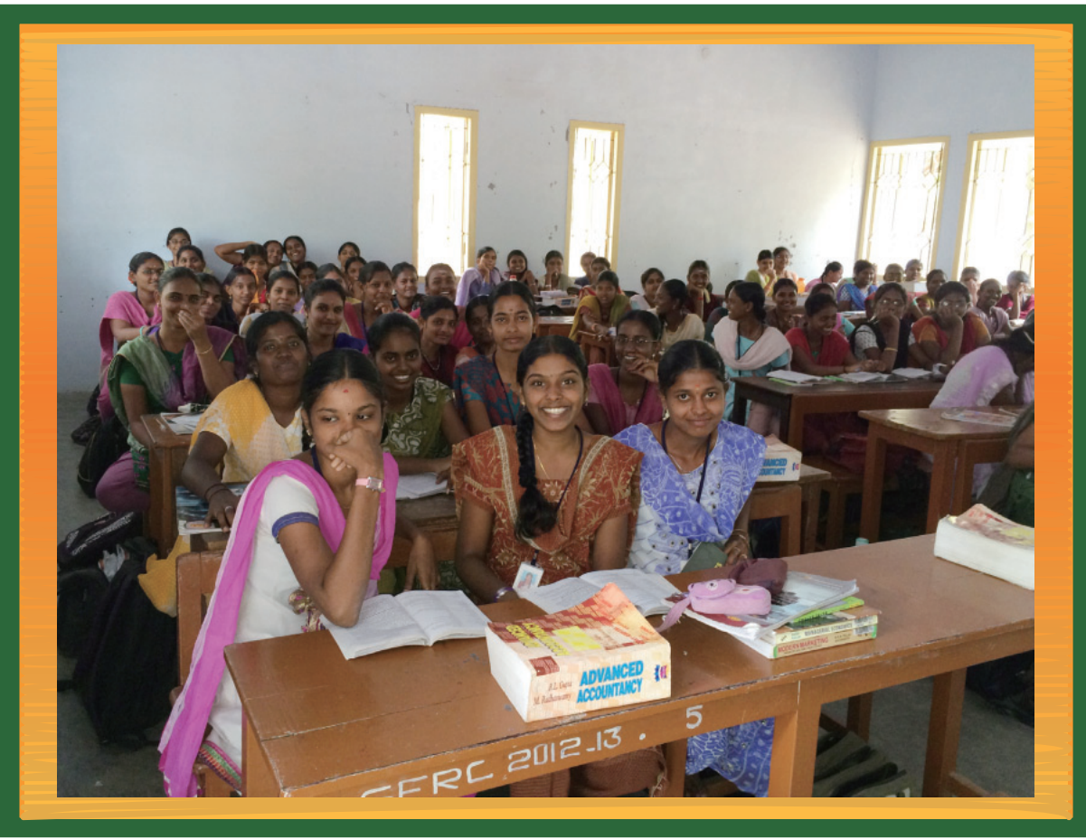
インド・タミルナドゥ州農村部の女子カレッジの教室にて。分厚い会計学の教科書に取り組む