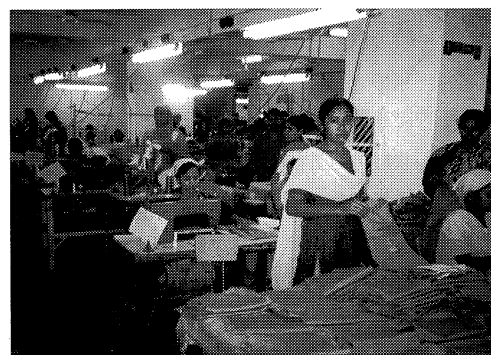
バングラデシュ縫製工場働く女工さん達

ミレニアム開発目標は途上国のみならず先進国も含む世界全体に要請された目標である。これを達成できなければ、先進国の姿勢も問われてしかるべきである。これまで先進国の国際協力パフォーマンスの程度を計る合意された基準はなかったのであるが、昨年アメリカのCenter for Global Development (CGD) という研究所が policy coherence という概念を打ち出し、先進国の政策