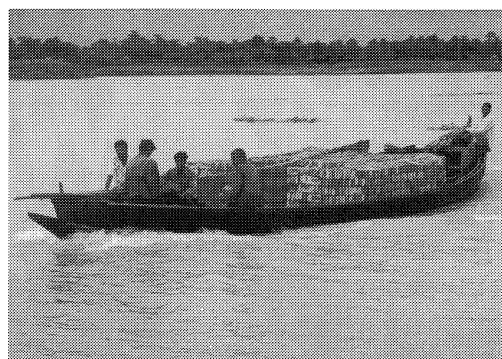
ちよっと大きめの舟でレンガを運ぶバングラデシュの人々

このように考えると、うまく説明のつくことがある。例えば現代人はパソコンや電気製品についての知識を持ち、それらを縦横に使こなしている