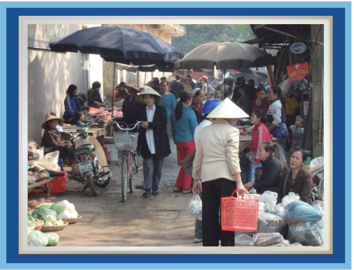
ベトナム北部西方地域に位置するホアビン省内の市場にて (撮影:寺本実 2013年12月8日)