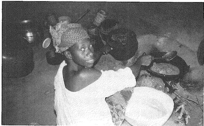
小銭かせぎのためのフルフル (揚げドーナツ)づくり

わせてくれる修理屋さんがある。これらは主婦の財産であり、誰誰さんの持ち物といわれ、決して何々家のものと言われたいのが面白い。また落花生をすりつぶすための紡錘形の石と、その台になるまな板状の厚い石、大きい木をくり抜いて作った脱穀に使うウスとキネも必需品だ。これらの道具は、この地方ではとても重要であるカリテの木の実の油を絞るのにも使われる。ウスとキネもサイズがさまざま、用途によって選ばれる。