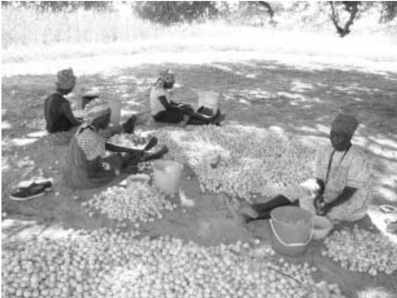
マルーラの果汁を搾る女性たち

ける性別分業がはっきりしており、牧畜や畑の耕起などが男性の仕事である一方、畑の除草や酒づくりなどは女性の仕事とされる。現在、女性の仕事の大部分は世帯が労働の単位となっている。しかし、マルーラ酒づくりでは複数世帯の女性によって共同労働がなされるのである。以下で酒づくりの手順を見てみよう。