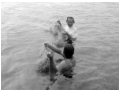
写真 2：養殖ユーケマの採取