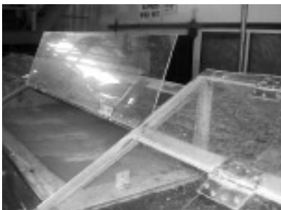
写真4：カラギーナン精製過程

藻養殖場の新設と海藻加工施設の改良を目的とする約三六万米ドルの補助金の支出を承認した。この補助金のうち約半分は、乾燥海藻製品 (dried seaweed chips) の製造に対応するための加工施設の改良に充てられる見通しである。さらに残りの補助金は海藻養殖場の新設や、その他の生産開発事業に使用される予定である。新設される海藻養殖場の規模は面積一七〇ヘクタール以上、乾燥海藻の生産能力四〇〇〇トン以上になる見通しである。その他にフィリピンでは、東アセアン成長地域 (BIMP-EAGA) の枠組の中で海藻業界の支援策が実施されている。先日フィリピンは他のBIMP-EAGA諸国 (ブルネイ、インドネシア、マレーシア) と共同で、同地域を世界最大の海藻輸出地帯とすることを目標に掲げた海藻業界開発五カ年計画を策定した。フィリピン貿易産業省 (DTI) によると、この新計画に基づいてBIMP-EAGA諸国は、相互協力関係を深め、輸出業者間の連携の強化と輸出品の一元化、業界が直面している制約要因の解消に取り組んでいく見通しとのことである (参考文献②)。