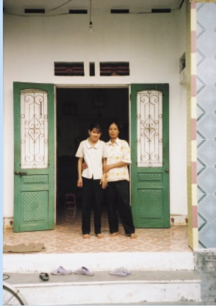
右の眼が不自由。枯葉剤による影響かもしれない