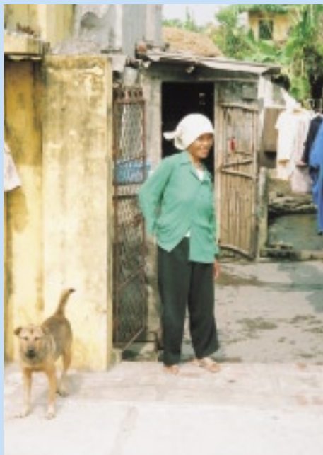
ろうの女性。手話は習わなかった