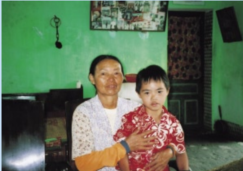
お母さんと。通学してないが元気だ