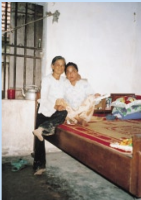
お母さんと。枯葉剤の影響が認定されている