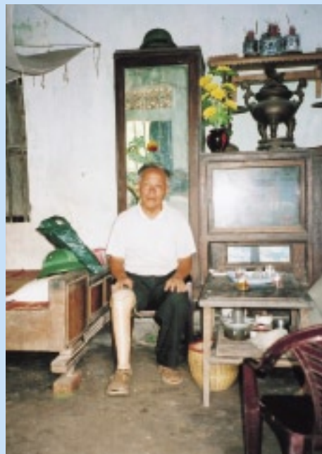
戦争で右膝下、右眼を失った退役兵士