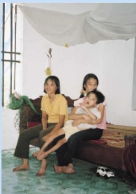
仲のいい姉たちと弟。枯葉剤の影響が認定されている