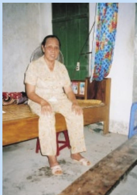
爆弾の破片が今も頭に残る

Iさんはベトナム南部ロンアン省、カン トー省で戦闘に参加し右足付け根から下を 失った。日課は幼稚園に通う孫の送り迎え。 義足をつけて自転車に乗る。 Jさんは一五歳の時に患った病気で視力 を失った。弟夫婦と同居している。義妹は しきりにKさんの優しさを口にした。六〇 歳まであともう少し。 Kさんは二〇代半ばの青年。中部高原で 軍に勤務し、数年後視力を失った。原因は 分かっていない。罹病後、新妻は姿を消し た。ベトナム中部トゥアティエンフエ省 で戦闘に参加した経験を持つ母親は枯葉剤 が原因だと主張、国の認定を求めている。 Lさんはドイモイが始まった年に生まれ た。笑顔がチャーミング。農業に従事する お父さんは自由に出歩くことを心配してい る。 Mさんはベトナム戦争が終了した年に生 まれた。穏やかな印象。ベッドの上で過ご すことが多い。睡眠時間が少なく、両親も よく眠れない。時々テレビを観る。 Nさんはなかなか咳が止まらない。心臓 が弱く、季節の変化も体に響く。お父さん が中部トゥアティエンフエ省、クアンチ 省で戦闘に参加した。枯葉剤被災者に認定 されている。 Oさんは還暦をすぎて数年たった。ハノ イ空爆の際の爆弾破片が頭の中に残る。視 覚に影響が出、左手が自由にならない。家 を二階建てにすることが夢だ。