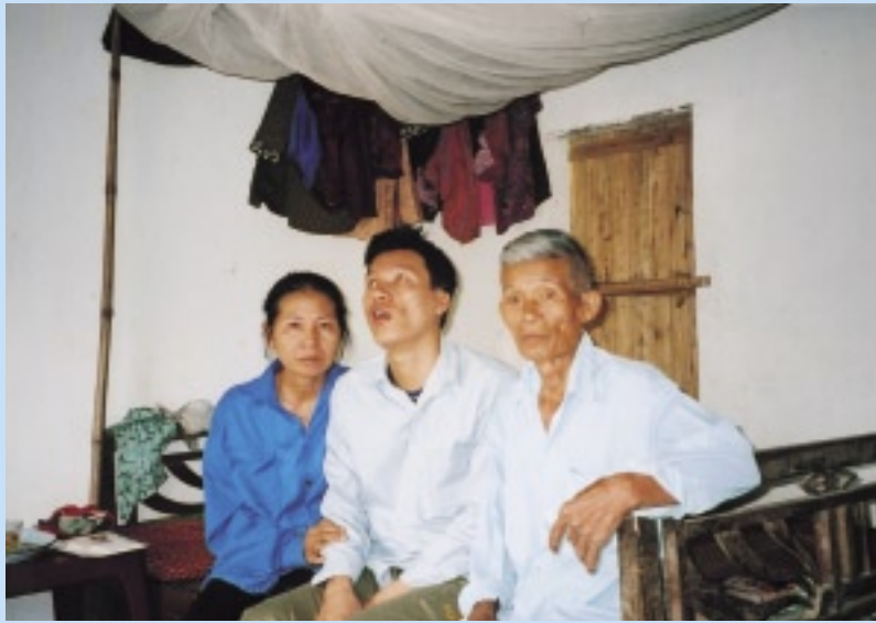
ご両親と。従軍後眼が不自由に。枯葉剤の影響か…