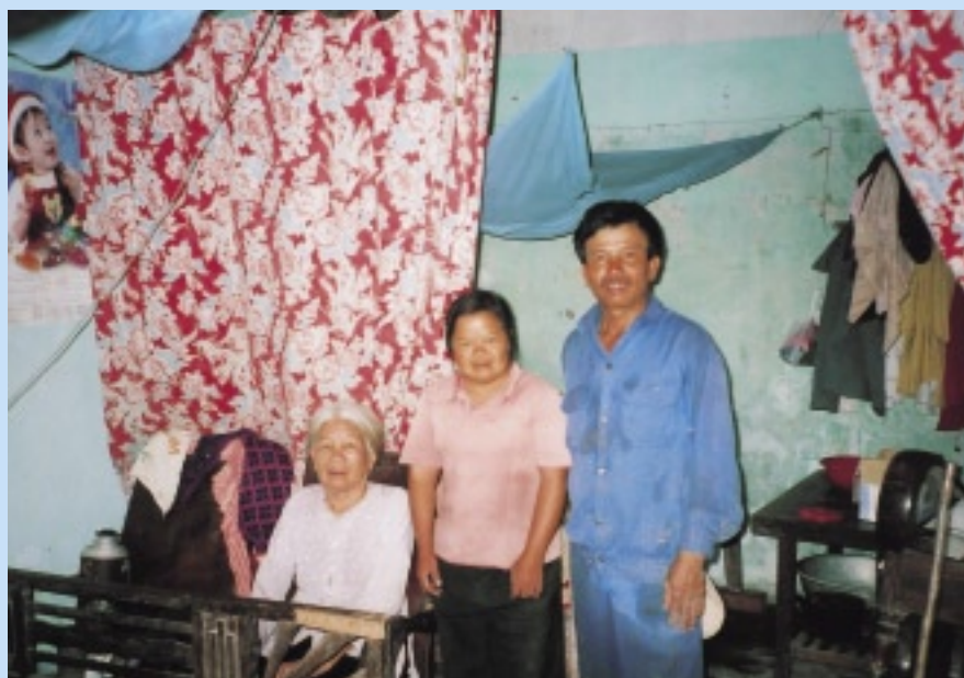
お母さん、お兄さんと。家畜の世話が得意