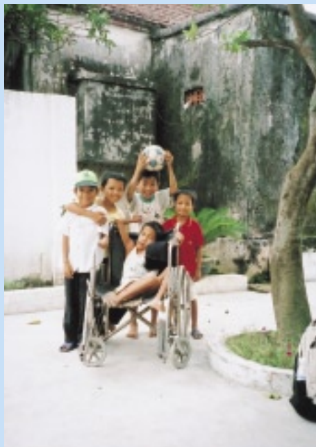
「僕は学校で勉強がしたい」