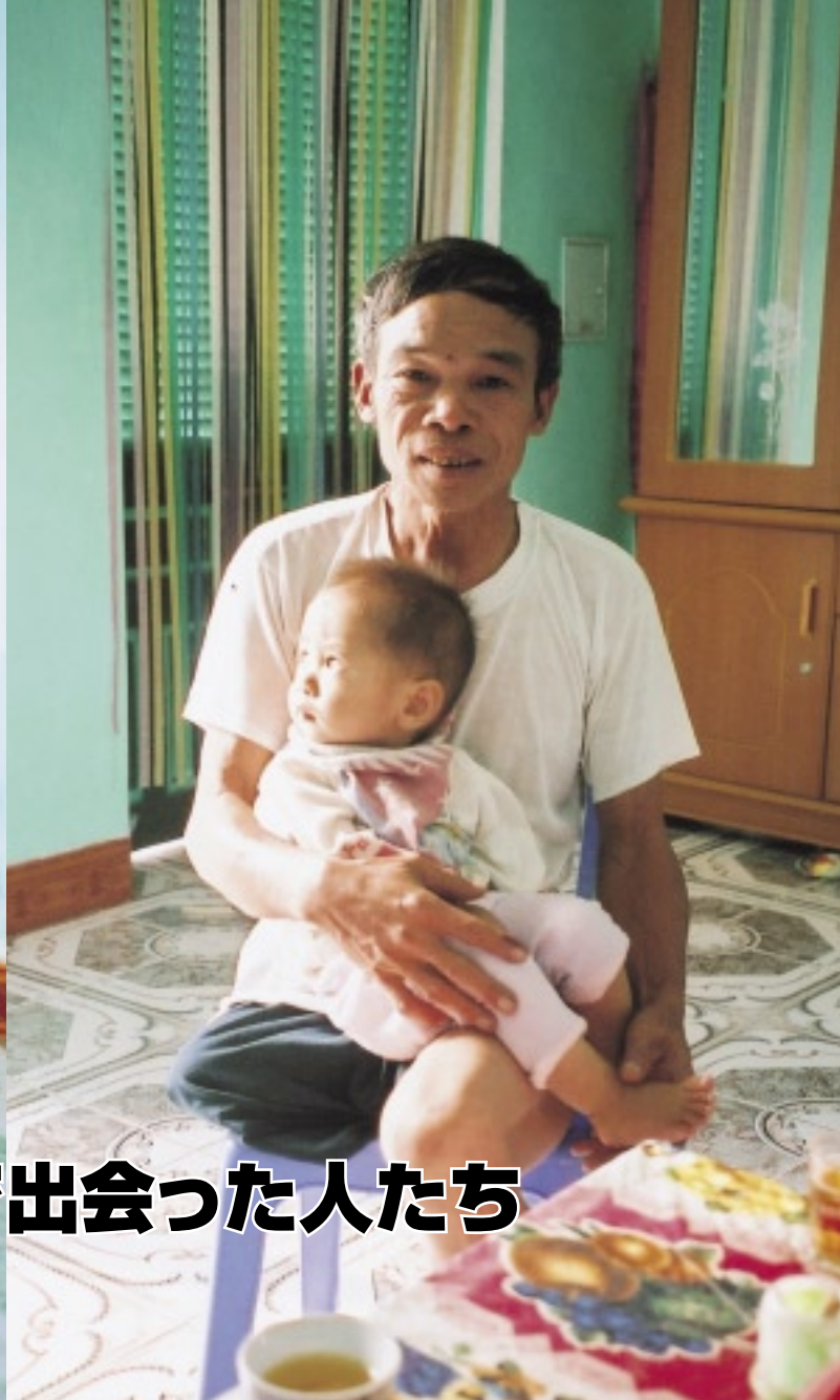
孫と過ごす戦争で腕や脚を失った退役兵士たち