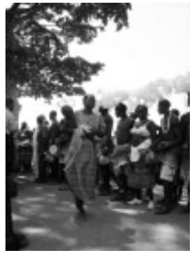
卵を踏み終えた女性と子ども。キャンプの人々が歓迎する。右側の人々はダンサー