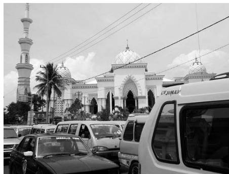
大モスク通りの交差点