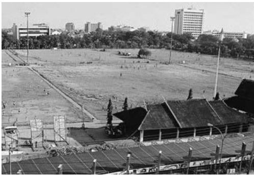
アバンダが練習するカレボシ広場