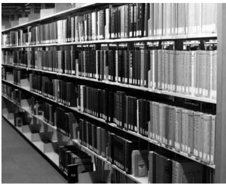
書架いっぱいになった中国地方誌叢書

働党機関紙の『労働新聞』の二紙である。当図書館では、継続受け入れしている新聞のほとんどを順次マイクロフィルム化している。これら六紙もすべてマイクロフィルム化されており、特に『朝鮮日報』と『東亜日報』は創刊年である一九二〇年から所蔵している。また『民主朝鮮』、『労働新聞』についても欠号が見られるが、いずれも一九四八年から所蔵している。