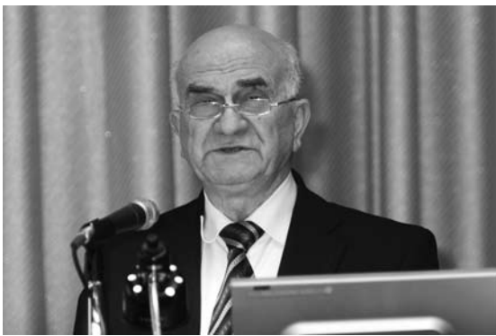
エフゲニー・ヤーシン氏